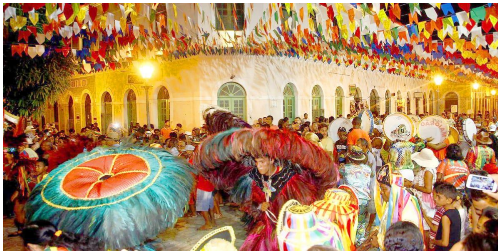
Figura 3: Circuito cultural do bumba meu boi do Maranhão.