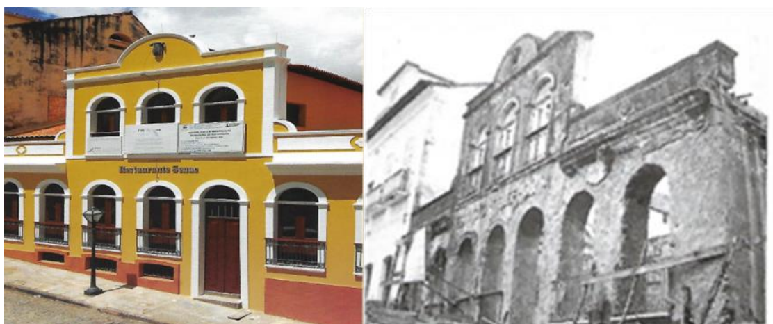
Figura 2: Antiga Companhia Telefônica, atual restaurante escola do Senac.

O programa de recuperação foi chamado de Projeto Praia Grande, bairro onde o programa se iniciaria, pois se tratava da área com os mais imponentes conjuntos arquitetônicos. O PPRCHSL se estendeu por 27 anos, de 1979 a 2002, e foi executado em seis etapas – refuncionalizando antigas áreas importantes para o patrimônio (Figura 2) e dando novas funções às formas preexistentes –, além de ser intercalado entre diferentes gestões governamentais, o que causava certa fragilidade e descontinuidade ao processo.