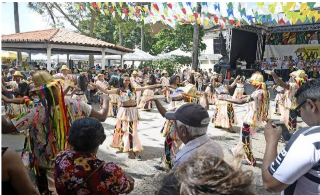
Figura 4: Manifestação cultural na Feirinha São Luís, Centro Histórico.

A Feirinha São Luís é uma iniciativa da prefeitura municipal para fomentar a agricultura de produção familiar, a produção artesanal e os artistas locais. Surgida em 2017, chegou a gerar uma renda em torno de R$ 60 milhões, segundo dados da prefeitura, em 120 edições, atraindo um público na faixa de 1,2 milhão de pessoas. Ao todo, 122 pessoas tinham permissão para comercializar seus produtos, agroecológicos, artesanais ou alimentícios vi . Além de fomentar a agricultura familiar local por meio dos pequenos produtores da zona rural, na feirinha também aconteciam vários shows com artistas locais a cada domingo.