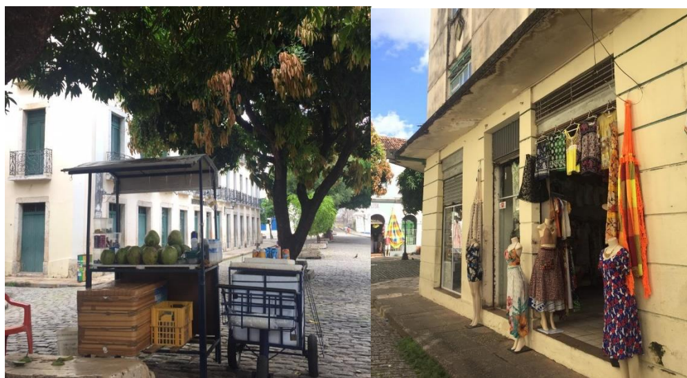
Figura 5: Pequeno comércio e comércio ambulante no Centro Histórico.

Com a retomada gradual das atividades, o movimento no comércio praticamente continua inexistindo (Figura 5), pois a orientação sanitária aconselhava que as pessoas evitassem a circulação em casos não essenciais. Ademais, o não retorno de atividades culturais no Centro Histórico, que “atrai os moradores e turistas para consumir, aumenta a crise para todos que dependem desses eventos” (proprietária de pequeno comércio, 18/07/20).