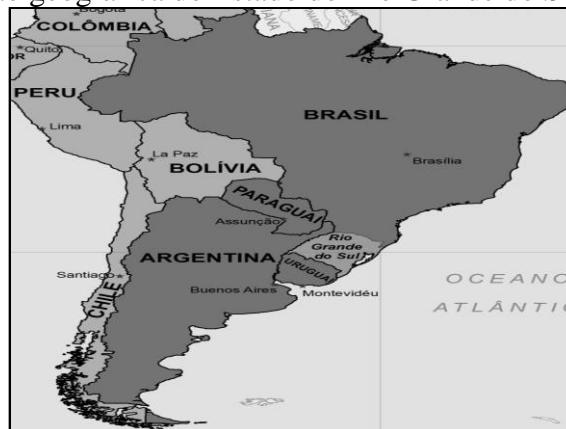
Figura 1 - Posição geográfica do Estado do Rio Grande do Sul no MERCOSUL

destaca a função das fronteiras no Brasil. Neste caso, evidencia-se a função do Rio Grande do Sul como território-elo. Tradicional território de disputas entre as cortes portuguesas e espanholas, o território sulino compõe, hoje, o núcleo geoeconômico do MERCOSUL, uma região diferenciada no conjunto dos países membros. A figura 01 expressa a posição geográfica do estado do Rio Grande do Sul.