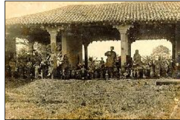
Figura 3: Imagem mostra o museu logo após sua construção e as esculturas que foram recolhidas na região.

As imagens e fragmentos esculpidos recolhidos ao Museu das Missões representam um patrimônio artístico de grande valor. Para melhor abrigar as imagens de madeira, foi feito fechamento das três seções do museu com grandes vidraças, de 0,005 m de espessura, colocadas em caixilhos de ferro, formando janelas fixas e portas de correr. (MAYERHOFER, 1947).