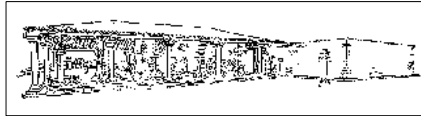
Figura 2: Perspectiva de Lúcio Costa, da fachada do Museu das Missões e casa do zelador, em posição oposta à adotada quando da construção.

Vimos na igreja uma peanha de linhas robustas e várias imagens de valor, algumas, porém, ao que nos informaram, posteriores aos jesuítas, entre estas um crucifixo em que a imagem do Senhor tem 1m e 63cm de altura. Disseram-nos, também, que por volta de 1902 foram trazidas para esta capital [Rio de Janeiro] várias carretas com material das missões, inclusive uma imagem de São Luís de grandes proporções (cerca de três metros) que foi aqui vendida, achando-se atualmente em St. Louis, E.U.A (PESSOA, p. 29-32).