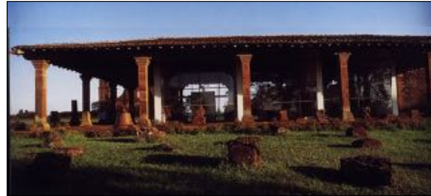
Figura 1: Fachada do Museu das Missões, localizado no sítio arqueológico de São Miguel.

Impossível desenvolver com sucesso o estudo da imaginária missioneira sem a devida valorização do acervo do Museu das Missões. Os museus, mais do que armazenar obras, são espaços onde se percebe, com maior ou menor nitidez, o conjunto formado por determinado grupo de obras de arte. Esta apreciação ultrapassa a percepção do objeto isolado e a noção do conjunto possibilita a criação de conceitos para uma discussão que evolui indefinidamente.