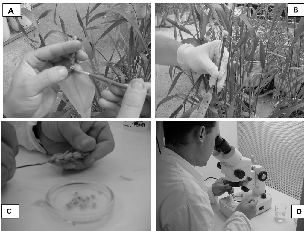
Figura 1 - (A)- Polinização com pólen de milho os antécios do trigo; (B)- Aplicação de 2,4D no colmo do trigo com agulha e seringa; (C)- Contagem do número de grãos cheios formados; (D)- Resgate de embriões haplóides com o auxílio de microscópio estereoscópico, FAEM/UFPEI, 2002.