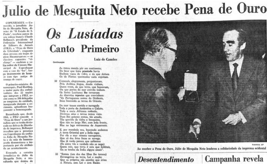
4 de setembro de 1974.

Documento 2 - Exemplar do O Estado de S. Paulo mostrando versos de Os Lusíadas ocupando o espaço de uma matéria vetada pela censura durante a ditadura militar