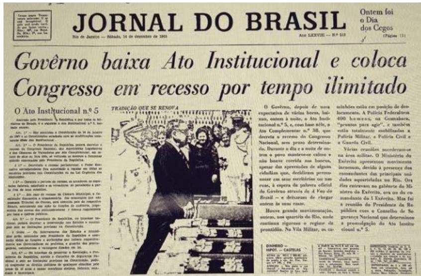
Fonte: Capa do Jornal do Brasil de 14 de dezembro de 1968.

Documento 1 - Capa do Jornal do Brasil de 14 de dezembro de 1968, publicada no dia seguinte ao AI-5, com a manchete “Ontem foi o dia dos cegos”