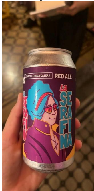
Figura 05 - Cerveja artesanal do Aireana

Fonte: Arquivo Ludmila Müller. Assunção, 13 out. 2024.