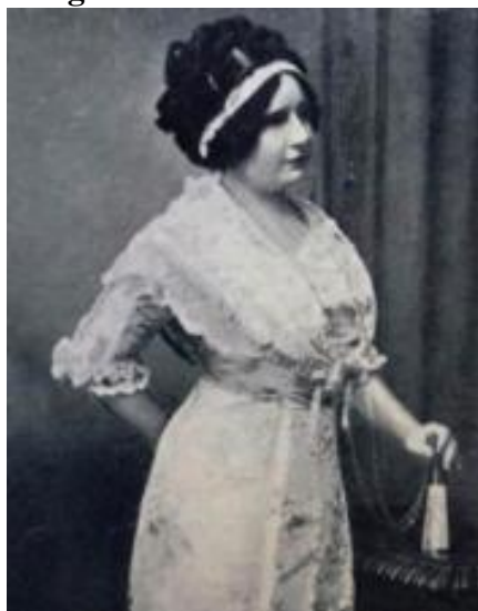
Figura 01 - Serafina Dávalos