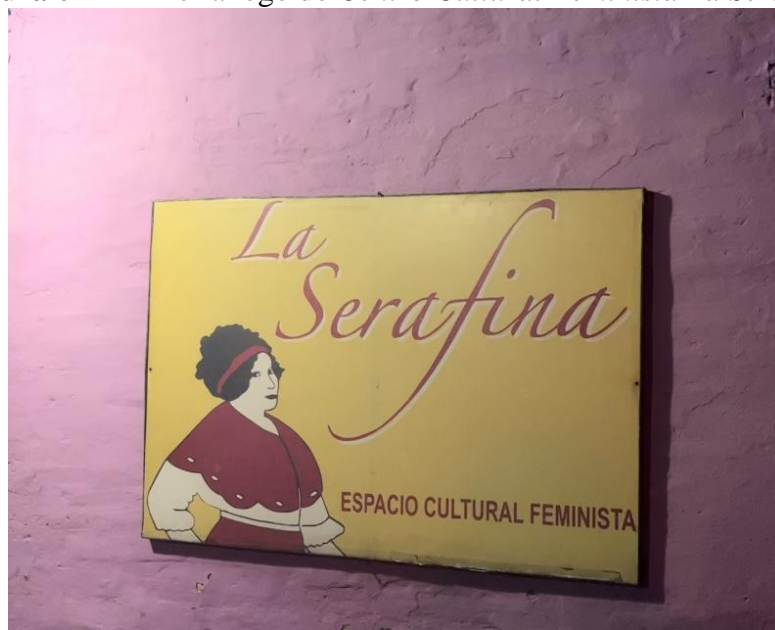
Figura 02 - Primeira logo do Centro Cultural Feminista La Serafina