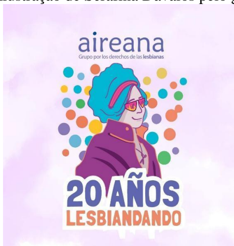
Figura 03 - Ilustração de Serafina Dávalos pelo grupo Aireana