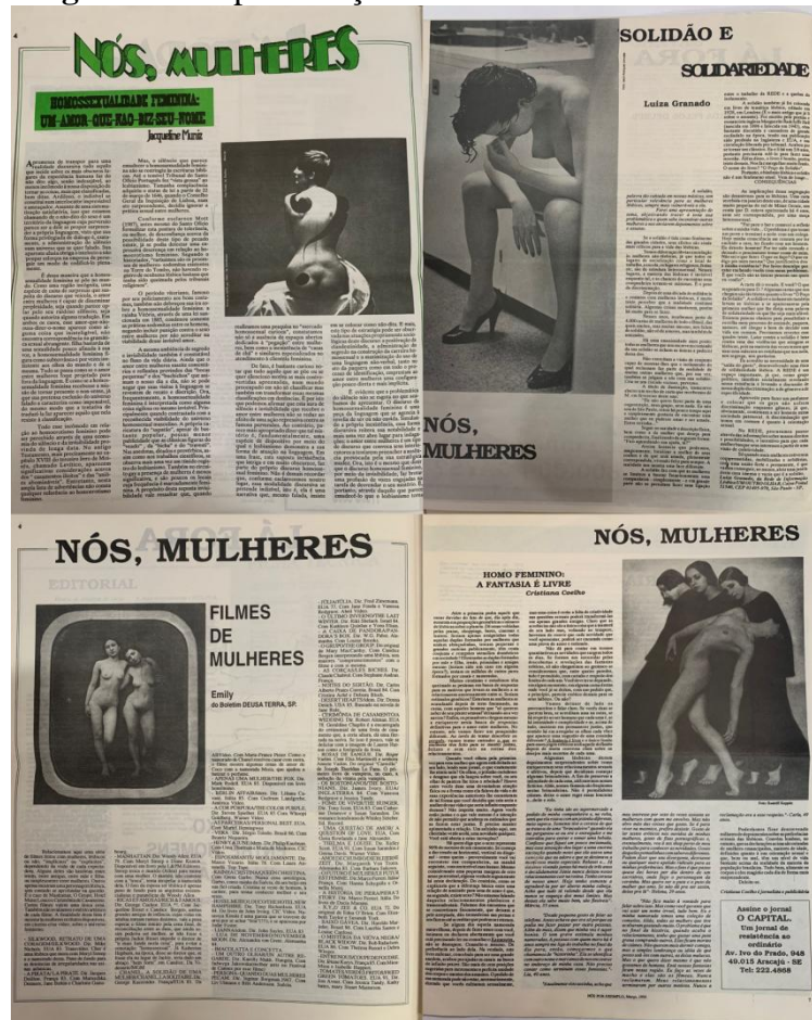
Imagem 2 – A apresentação visual da sessão Nós Mulheres