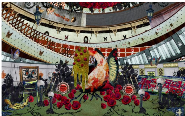
Figura 4 – Gertrud, a Bruxa do Jardim de Rosas