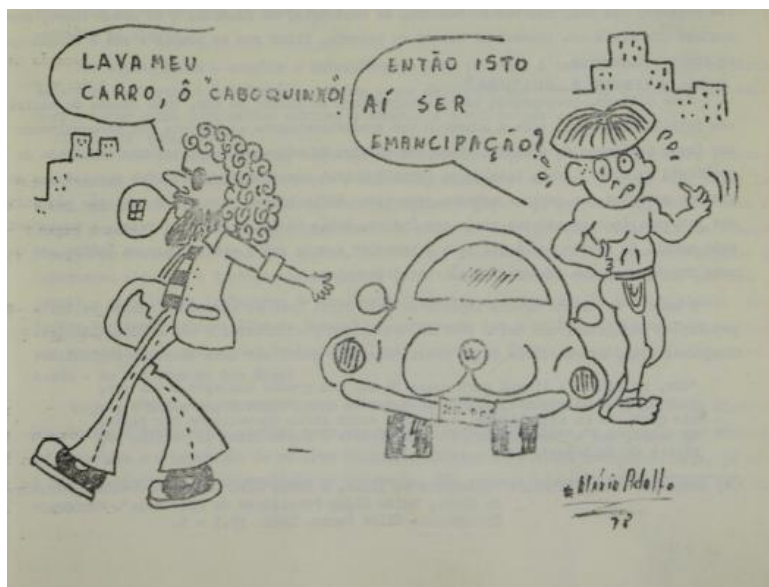
Figura 1 – Charge sobre emancipação

Fonte: Porantim, n°03, jul. 1978. Pág. 7.