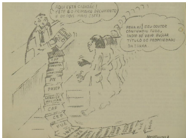
Figura 3 – Charge sobre titulação das terras indígenas