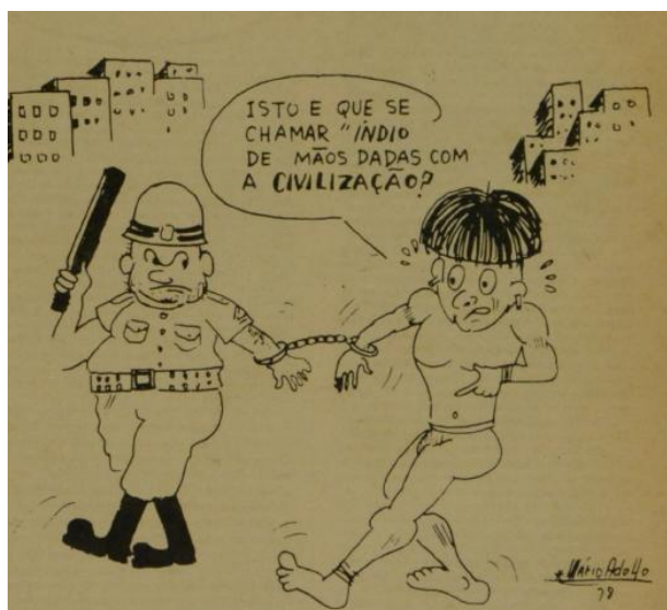
Figura 5 – Charge sobre “civilização”