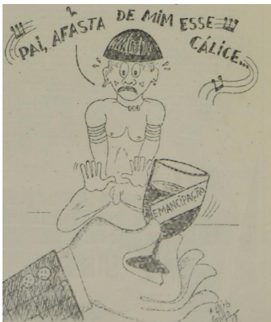
Figura 4 – Charge “Pai, afasta de mim esse cálice”