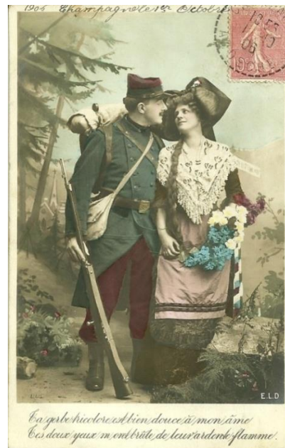
Figura 6. Autor/Editor não identificados. Cartão-Postal n. 4140. Expedido em 01 out. 1906.