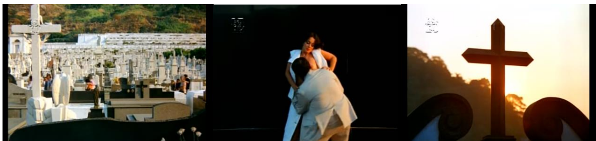
Figura 3: Ouvimos o grito da personagem e, no próximo segundo, o campo é direcionado à imagem da cruz, representando a transgressão da moral cristã e a relação entre prazer e culpa vivida por Solange. Início/fim: 108min55s 111min05s decorridos do filme.

A trilha acompanhou o uso constante de uma decupagem clássica, com cenas filmadas em sequência, com plano conjunto e câmera fixa. O que fugiu dessa “regra” estética foi percebido pelos críticos como breves enxertos de “originalidade”, que flertaram intimamente com o neorealismo italiano e com o cinema novo. Isso ficou evidente em dois diferentes momentos: no primeiro, Solange encontra um desconhecido no transporte público e o leva para um cemitério próximo, no qual, seguidos da canção-tema em tom melancólico, fazem sexo à luz do dia simultâneo a um cortejo fúnebre; no segundo, há a construção alternada entre sonho e realidade da personagem Solange, que, ao lado do marido (espaço real), sonha estar correndo entre os ônibus estacionados em uma garagem (espaço fantasia).