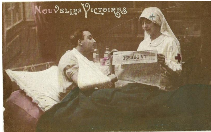
Figura 4 – Autor/Editor não identificados. NouvellesVictoires. Manuscrito pelo remetente em 19 abr. 1915.

Na Figura 4 vemos uma enfermeira que lê as notícias do jornal para o soldado que se encontra ferido, em repouso, enquanto se mostra interessado e atento ao que ela diz.