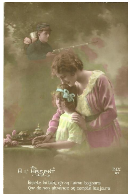
Figura 2. DIX. Cartão postal n. 87. Al' Absent. Repète lui bien qu'on l'aime toujours / que de son absence on compte les jours . Não datado.