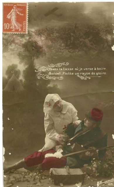
Figura 3. Revanche. Cartão-postal n. 103. Dans La tasseoùje verse áboire. / Soldat, flotte um rayon de gloire.. Postado em 02 fev. 1915.

A batalha em evidência no topo da imagem distancia a mulher e o campo de combate, que é assim proposto como um ambiente exclusivamente masculino. Cabe a ela colaborar na recuperação do soldado, de forma que ele possa retornar ao combate.