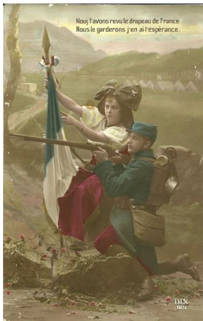
Figura 5. DIX. Cartão postal n. 125. Nous l'avons revu Le drapeau de France / Nous le garderons j'en ai l'espérance. ..Manuscrito pelo remetente em 10 jul. 1915.

O casal figura com certa proximidade, e o olhar evoca desejo, romance, atração. Novamente, trata-se do mesmo sentimento que permeava o imaginário francês: a nação francesa, personificada pelo militar, tem como compromisso e desejo retomar o território da Alsácia-Lorena.