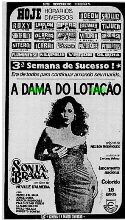
Figura 2: Propaganda do filme na sessão “Estréias da semana”, no Jornal do Brasil, Ed. 00021, Caderno B, 29 de abril de 1978, p. 8.

Nesse cartaz publicitário, faz-se menção à terceira semana seguida de “sucesso” de bilheteria, notificando o possível espectador de que se refere a um filme colorido e reforçando a questão do longa-metragem se tratar de uma adaptação de Nelson Rodrigues com canção-tema de Caetano Veloso, a qual ganha diferentes tempos a cada nova cena de traição (acelerada ou desacelerada) estabelecendo um código com o público que assiste: