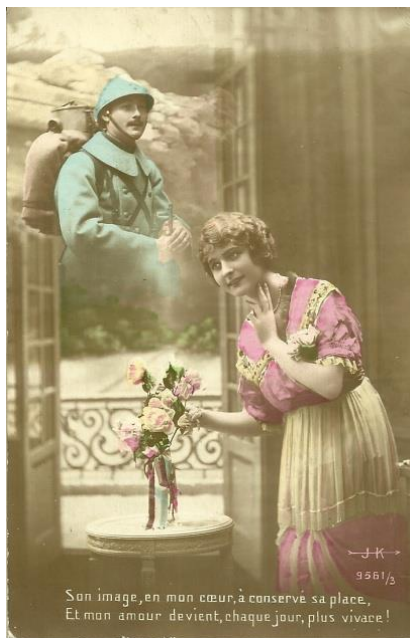
Figura 1. A. H. Katz./J. K. Cartão-postal n. 9561/3. Son image, en mon cœur, à conservé sa place, / Et mon amour devient, chaque jour, plus vivace! . Manuscrito pelo remetente em 28 mar. 1916.

A jovem da Figura 1 é representada dirigindo seus pensamentos ao soldado que está em combate, enquanto ela, distante das batalhas, espera resignada seu retorno. As fitas em torno do ramalhete de flores, em sinal de boa sorte, fazem referência às cores da bandeira francesa, e evidenciam o apoio dirigido aos combatentes.