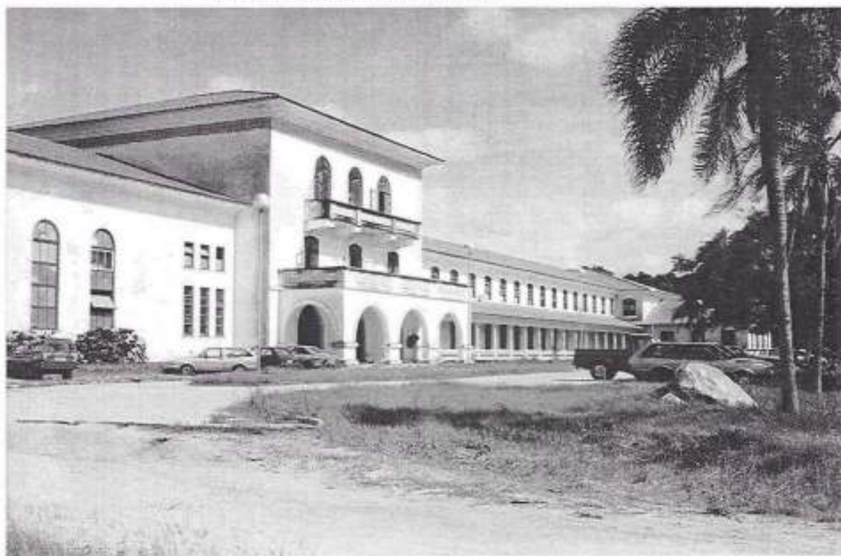
FACULDADE DE AGRONOMIA ELISEU MACIEL