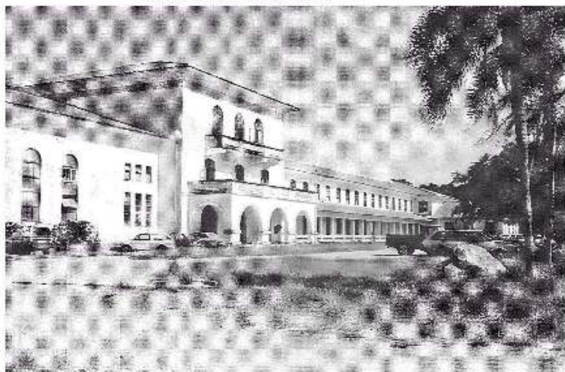
FACULTAD DE AGRONOMIA ELISEU MACIEL