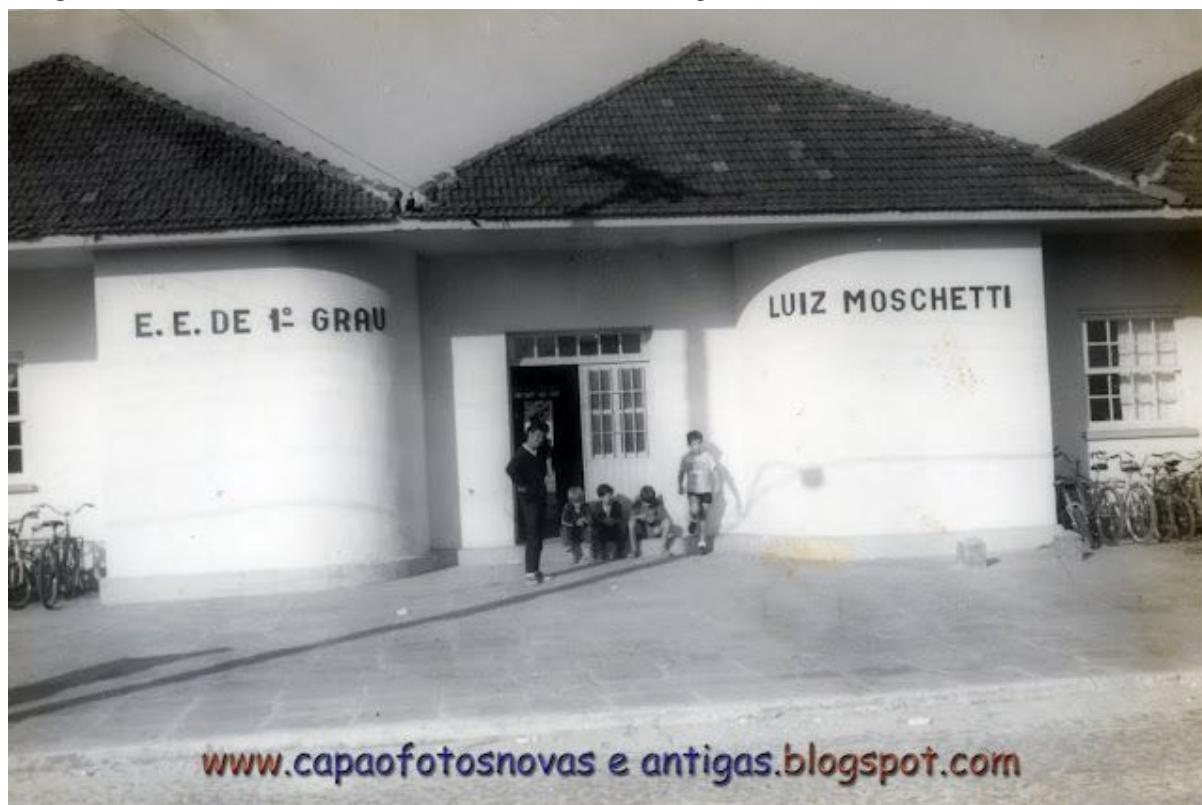
Imagem 2: Escola Estadual de Ensino Médio Luiz Moschetti - Capão da Canoa/RS.