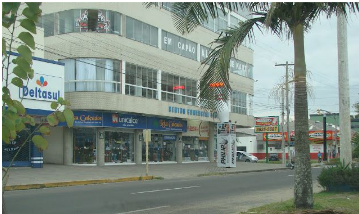
Imagem 1: Local onde era a Escola Estadual de Ensino Médio Luiz Moschetti - Capão da Canoa/RS.