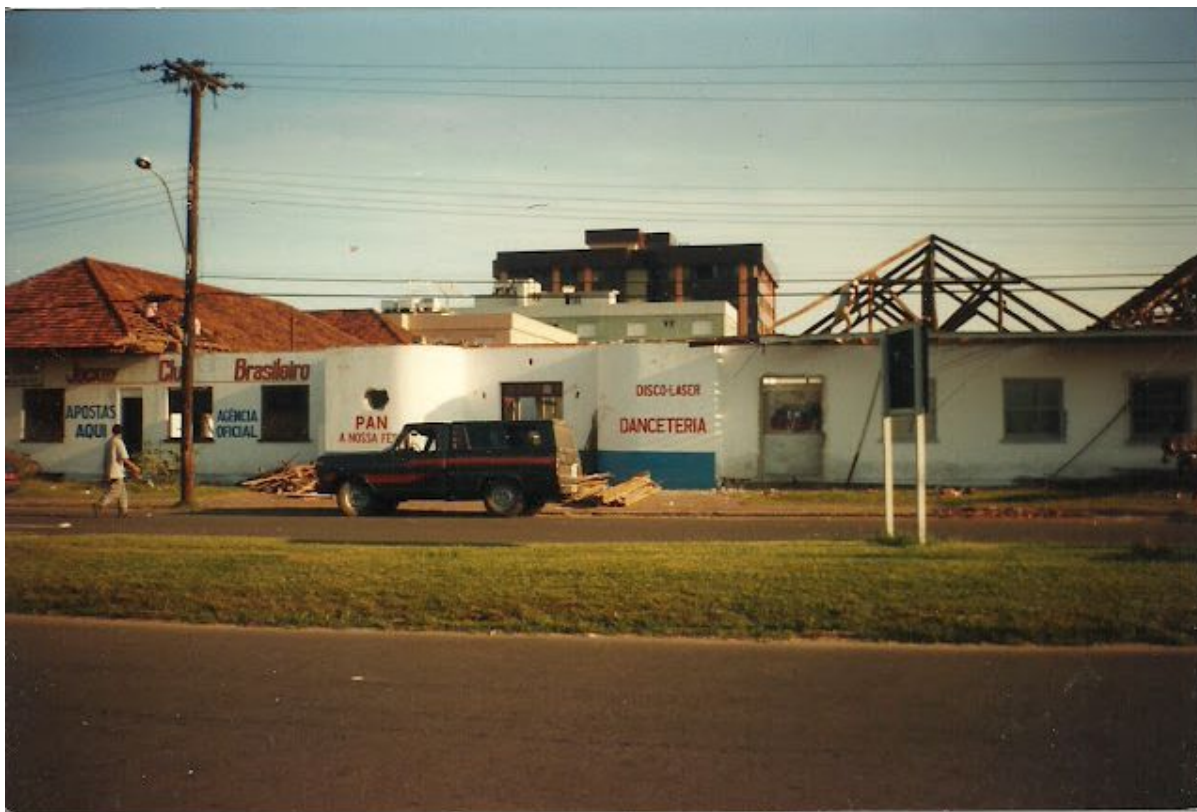
Imagem 3: Local onde era a Escola Estadual de Ensino Médio Luiz Moschetti - Capão da Canoa/RS.