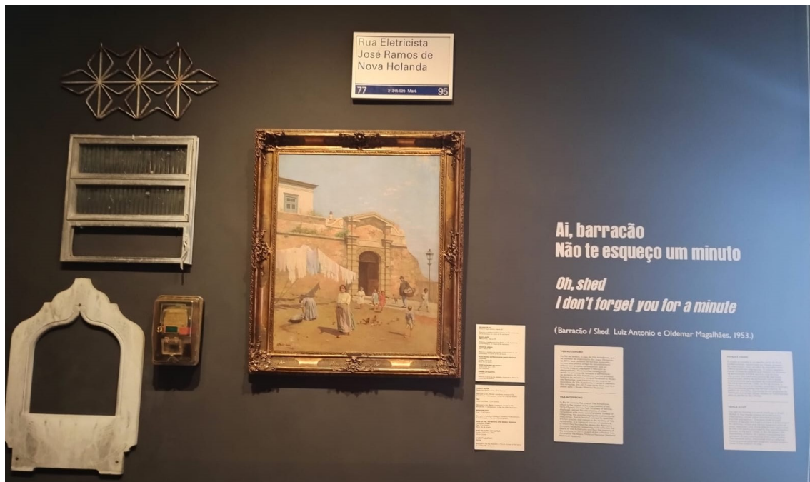
Figura 3: Piezas de viviendas del Monte del Castillo y de Villa Autodromo.

Al lado de esos textos, un óleo sobre lienzo del pintor italiano Gustavo Dall’Ara, titulado Fuerte del Monte del Castillo (1922) y algunos objetos y fragmentos de las viviendas del Monte del Castillo y de Villa Autodromo, como por ejemplo, un medidor de energía, un pivotante y una reja de Villa Autódromo, y un fragmento del lavatório de la sacristía de la Iglesia de San Sebastián, ubicada en el Monte del Castillo (Figura 3).