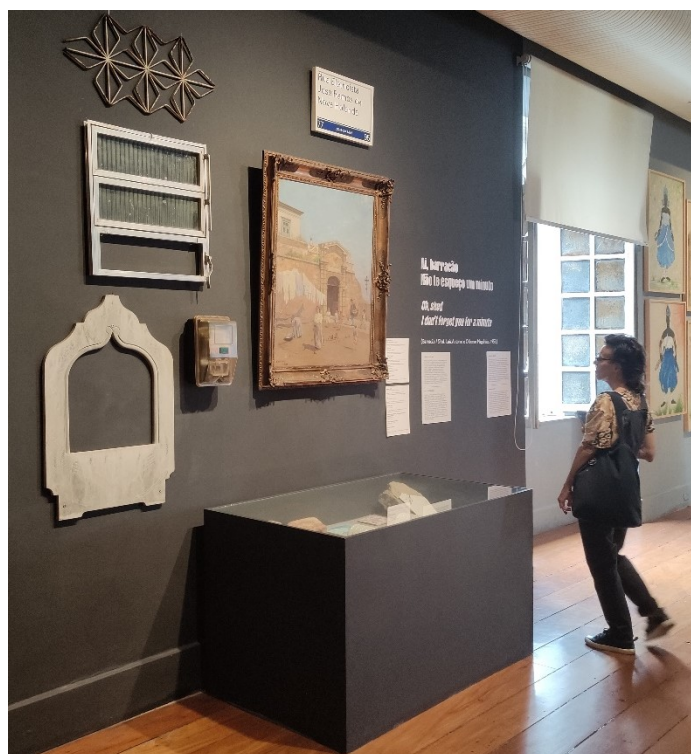
Figura 2: Visión general de la parte de la exposición Ciudadanía dedicada a los desahucios del Monte del Castillo y de la Villa Autódromo.

En la pared, en destaque por el tamaño de la letra, el refrán de la canción titulada Barracão (Choza) 23 , en lengua portuguesa e inglesa, y dos pequeños textos, elaborados por las fundadoras del MdR. Estos son los soportes informativos del conjunto de piezas del acervo del MHN que materializan los desahucios de las comunidades del Monte del Castillo y de Villa Autódromo (Figura 2).