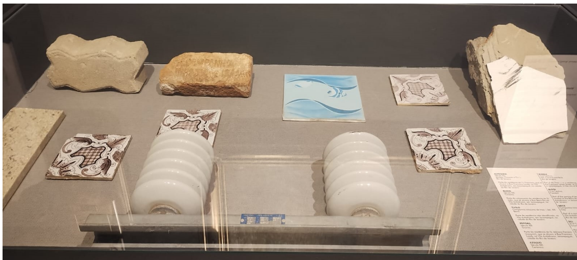
Figura 4: Fragmentos de viviendas de la Villa Autodromo.

Otros objetos, exhibidos en un escaparate desde una disposición tipológica de los objetos, componen esta parte de la exposición Ciudadanía , como baldosas y ladrillos (Figura 4).