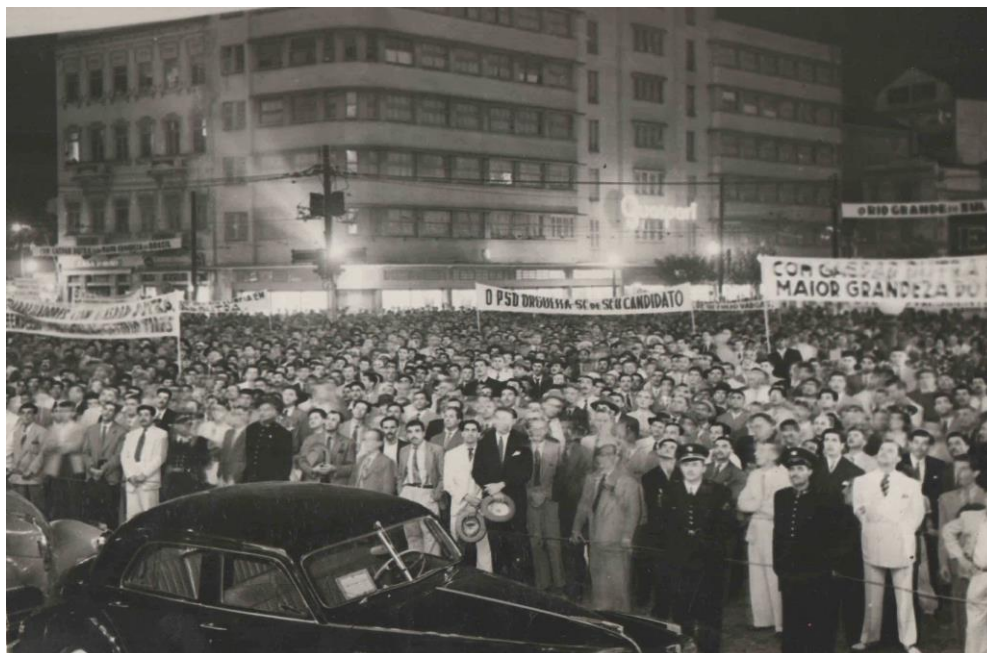
Figura 2: Campanha eleitoral de Eurico Gaspar Dutra em Porto Alegre (1945)