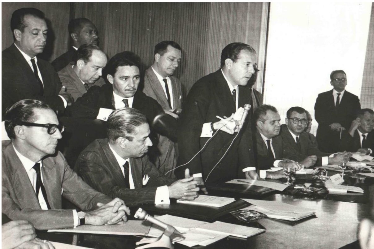
Figura 10: Gabinete de Francisco Brochado da Rocha (1960)