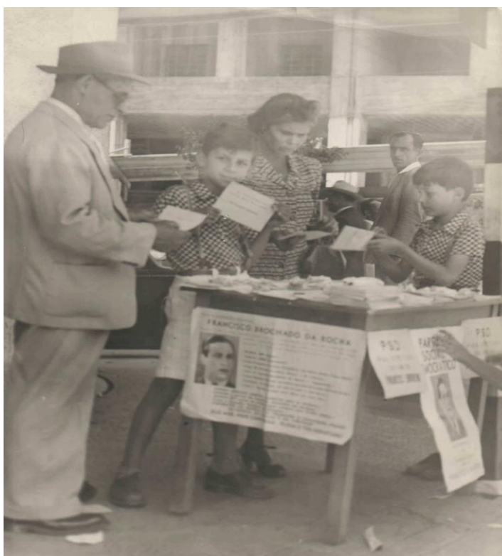
Figura 1: Campanha eleitoral de Francisco Brochado da Rocha (1947)