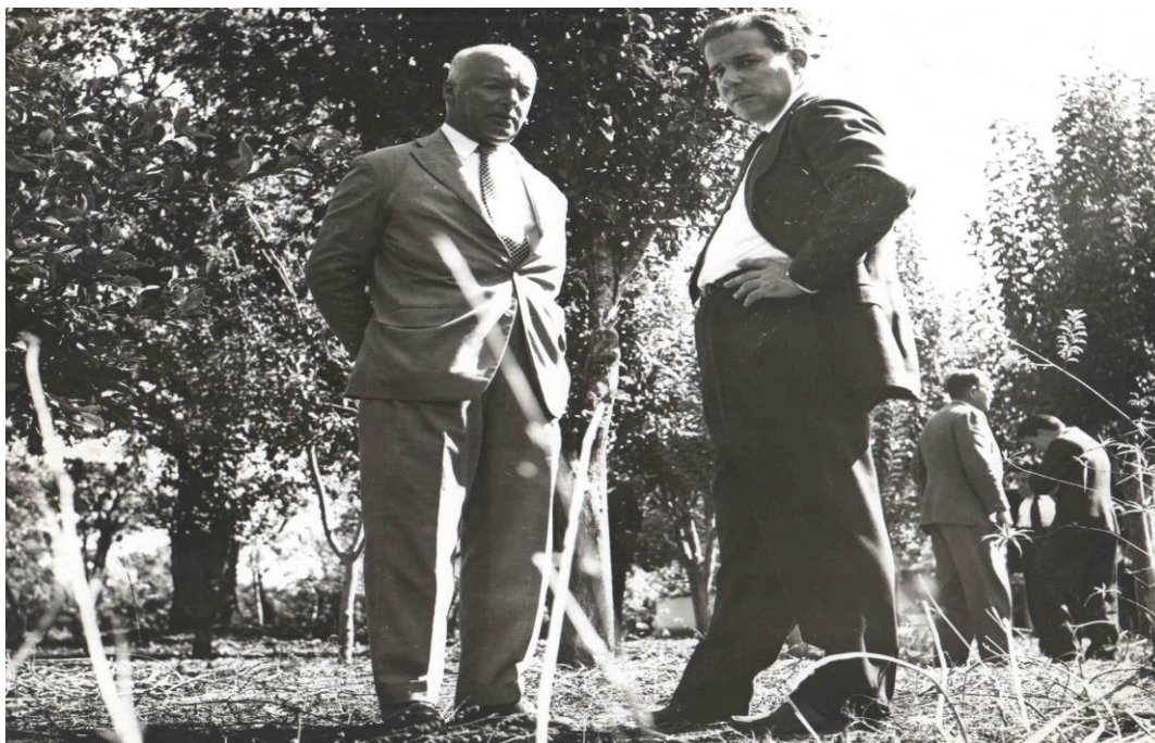
Figura 5: Campanha eleitoral de Henrique Lott e João Goulart (1960)