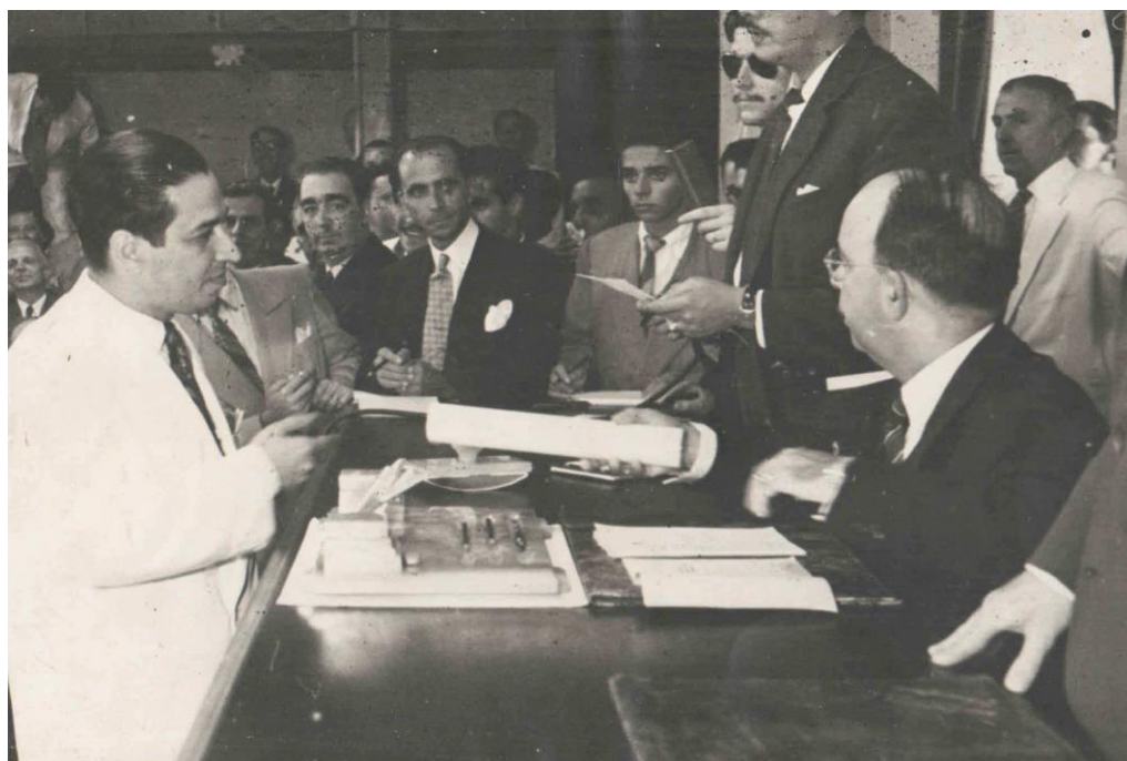
Figura 8: Francisco Brochado da Rocha na comissão constitucional (1947)