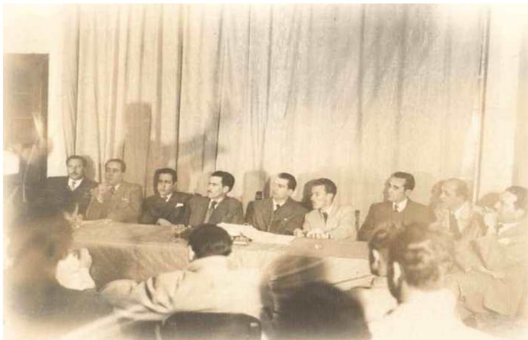
Figura 9: Reunião da Ala Moça do PSD (sem data)