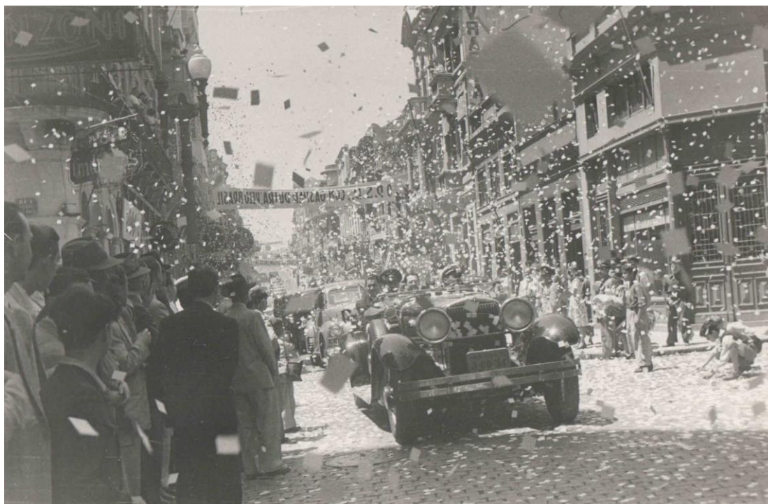
Figura 3: Campanha eleitoral de Eurico Gaspar Dutra em Porto Alegre (1945)