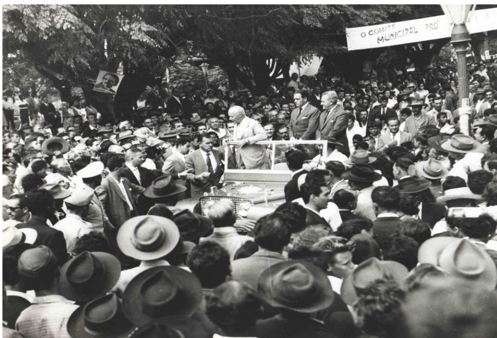
Figura 6: Campanha eleitoral de Henrique Lott (1960)