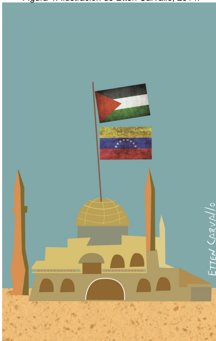
Figura 4. Ilustración de Etten Carvalho, 2014.