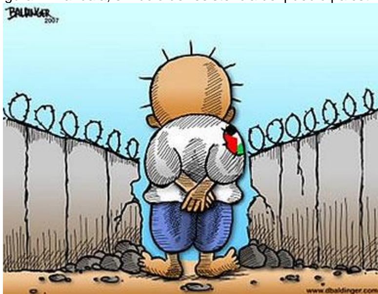
Figura 1. Handala, símbolo de resistencia del pueblo palestino.