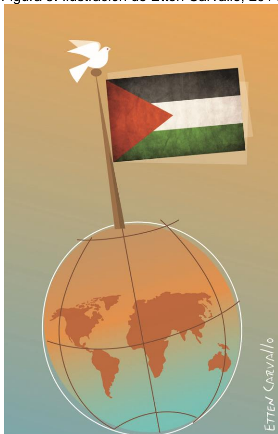
Figura 5. Ilustración de Etten Carvalho, 2014.