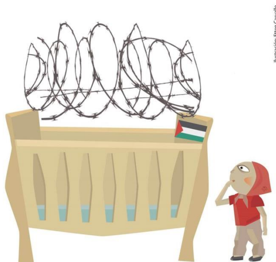
Figura 2. Ilustración de Etten Carvalho, 2014.