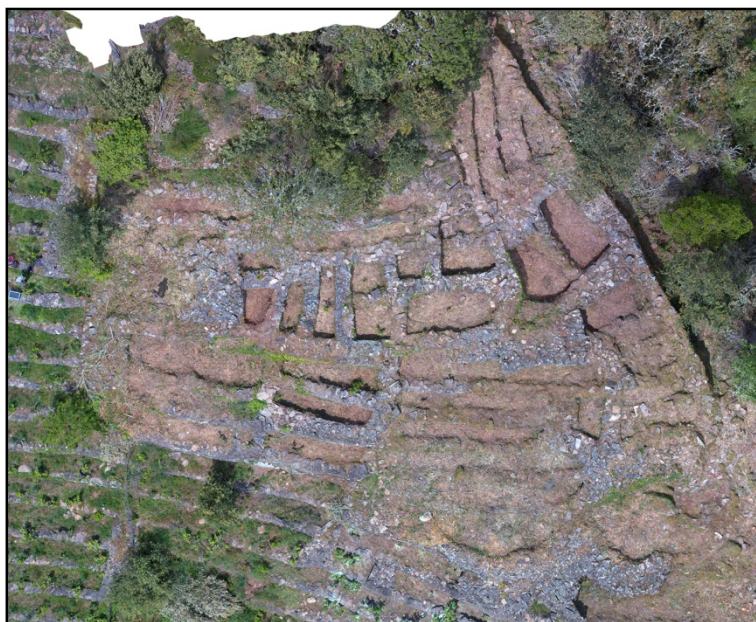
Figura 4. La Ribeira como geografía ancestral. Fotografía aérea del yacimiento arqueológico de Os Conventos, al iniciar la excavación de mayo de 2019.

Yo lo que he oído es que había el convento y la Santa Inquisición. Y que había, que castigaban mucho a la gente, que tenían una sierra, los montaban en una sierra a y que los serraban en vida hasta que morían así. Y que a otros que les ponían agua en la cabeza, una gotera y que morían así. Los que tienen viñas ahí todavía encuentran cavando cosas que tienen relación con el convento de ahí. Las bodegas de Vilachá eran de los monjes, que fueron los que cocían el vino abajo en los conventos y que lo traían aquí. Eso fue lo que se contó siempre.