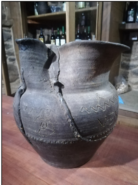
Figura 6. Resiliencia. Antigua jarra para servir vino con simbología comunista grabada. Bodega de O' Morales.

El proyecto Adegas da Memoria ha servido para sacar a la luz pública, por vez primera, estos testimonios públicos sobre la violencia ejercida por los perpetradores, a veces de manera coral y no tanto a nivel personal. Nuestro trabajo de Historia Oral en Vilachá ha permitido conocer al detalle y dignificar la memoria de dos víctimas. El primero de ellos era el maestro nacional del pueblo, Juan Abramo Dios. Podría ser perfectamente el protagonista de La lengua de las mariposas , el relato de Manuel Rivas llevado al cine por José Luis Cuerda (1999). En esta obra se resume de manera magistral la masacre efectuada por el fascismo entre los maestros, que eran un símbolo de los nuevos tiempos republicanos. O' Madera, el más anciano de Vilachá, fue alumno de Abramo: El maestro no era de aquí. Le llamaban don Juan, pero no me acuerdo de dónde era. Lo querían matar y lo mataron por ahí por Abrence.