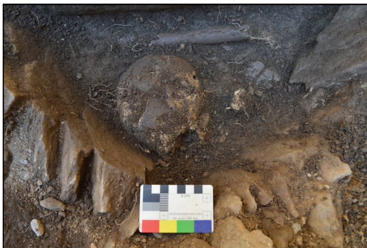
Figura 5. A la busca de los abuelos . Enterramiento secundario del siglo X documentado la excavación arqueológica de Os Conventos.

guía. El mito no está reñido con la ciencia. Los vecinos y vecinas (esas voces subalternas) sabían, porque se lo escucharon a sus abuelos, y sus abuelos a sus abuelos, que en Os Conventos podría estar el origen de la comunidad, en esa Ribeira en la que vivían los mouros y los aláparos . La Historia Oral arroja luz sobre los Siglos Oscuros.