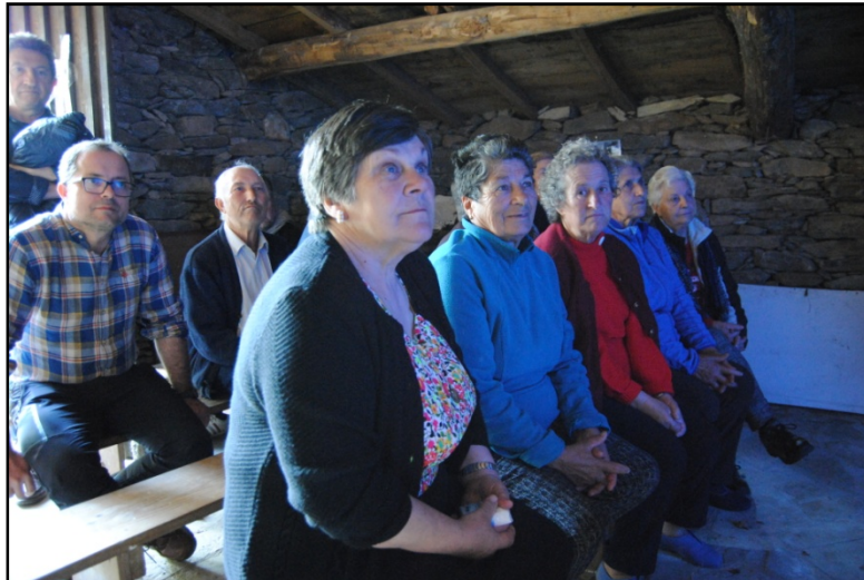
Figura 3. Estreno en la bodega-museo de la primera temporada de la webserie Adegas da Memoria, protagonizada por los vecinos y vecinas de Vilachá.

Para nosotros, los vecinos y vecinas de Vilachá no son meros reproductores de audio o informantes colonizados. Empleamos la Historia Oral como herramienta, no solo para registrar un mundo que desaparece, sino también para dar voz a aquéllos y aquéllas a los que se ha arrojado a los márgenes del discurso oficial. A partir de la materialidad del pasado (restos arqueológicos) y la memoria oral queremos devolver el protagonismo a esta gente, que sea ella quien nos hable de su propia historia, de su relación con el paisaje y los antepasados, que nos interpele y nos avance sus perspectivas de futuro. Desde estos parámetros, propios de cualquier Arqueología indígena actual, llevamos a cabo entre febrero y marzo de 2019 un total de 30 entrevistas, escuchando a la práctica totalidad de la comunidad. Los encuentros con estas voces ceibes fueron grabados por nuestros compañeros de la productora Nas Beiras y constituyen la base que sostiene el hilo argumental de la serie documental Adegas da Memoria , de la que se han emitido ya dos temporadas (pueden verse en abierto en Vimeo).