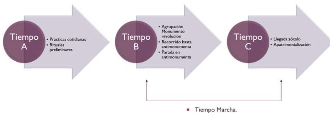
Figura 3: Temporalidades de la marcha.

Este análisis dentro de la marcha permite identificar tres temporalidades nombradas como “A”, “B” y “C”, donde “B” y “C” se desarrollan dentro de la temporalidad de la marcha y “A” en la semana anterior de la marcha como se puede observar en la figura 3.