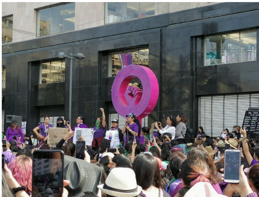
Figura 4: La Antimonumenta frente al Palacio de Bellas Artes