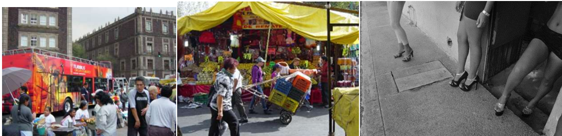
De la “marca de lugar” a los lugares de experiencia en el Centro Histórico de la Ciudad de México

Ambas manchas se complementan y aparecen como necesarias una de la otra, ya sea para justificar su condición “decente” y dedicada al hogar (Ortiz, 2008), o bien para vivir de la imagen opuesta (indecente) que se vende a los hombres “solos” (poligámicos) que se enfrentan sin remedio a la condición de dominación que históricamente se ha construido como una de las formas del patriarcado, donde no solo se somete el cuerpo de la mujer, sino de los hombres, a las condiciones y relaciones de poder imperantes, donde no solo es un problema normativo o legal que banaliza y normaliza la situación de las mujeres prostituidas, sino del conocimiento de esa condición de desigualdad como argumento de la lucha feminista por la reciprocidad sexual (De Miguel, 2012), pero también en el caso de las otras mujeres sometidas por el régimen patriarcal dominante, ahora en su modalidad neoliberal, que disputan el territorio entre marcas alegóricas y procesos de resistencia cultural. Se trata de identidades sociales complejas que se arraigan en los lugares, principalmente patrimoniales, y que se resisten a las marcas comerciales del lugar, al menos hasta ahora.