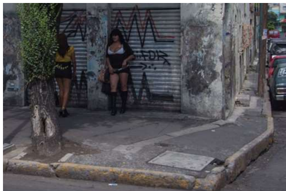
Sexo servicio en La Merced (Vice, 2016)

Lo que hace del mercado del sexo en La Merced una experiencia particular, es su carácter público (callejero), desinhibido y alegre de las “chicas” (sexoservidoras), como una forma sociocultural que detona y marca el sentido de las prácticas: el cliente común es un hombre sensible a la ausencia del placer erótico en las formas sociales del amor romántico (noviazgo o matrimonio) y el no sentirse “amado” (valorado sexualmente) o en soledad; es el deseo de todo ello, lo que busca y como tal reacciona al ser interpelado con una frase seductora que lo mira, saluda e invita: “¡Hola mi amor...!”