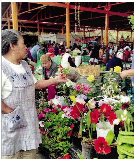
Marchanta con mandil (PRI, 2015)

personal no ostentoso pero limpio, usualmente peinadas con el cabello recogido, además una parte significativa de su indumentaria es el “delantal o mandil” de distintos estilos y colores, casi siempre con bolsas al frente (para el monedero y las llaves) -parecido al de su marchanta pero distinto la especialidad (carnicería o la cremería, por ejemplo)-, además usan calzado bajo, cómodo y sencillo, algunas guardan el dinero en billetes en el sostén, otras cargan un morral pequeño o bolsa de mano, pero invariablemente una o más bolsas de mandado , que eventualmente combinan con un carrito de mano, aunque si exceden en volumen y peso, siempre hay un “diablero” disponible, ya conocido.