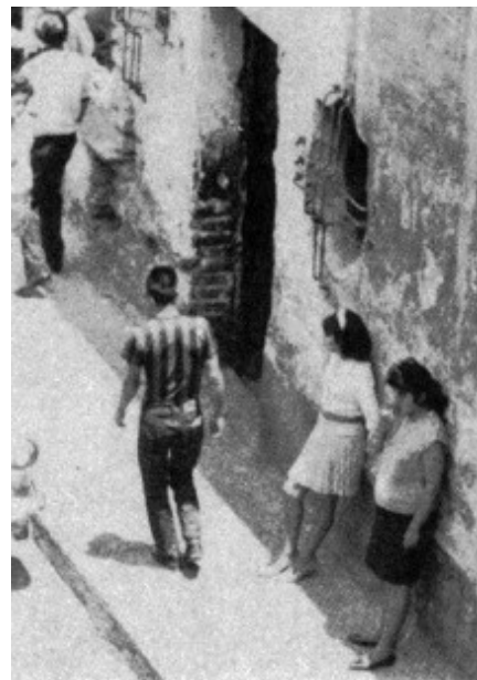
Sexo servicio en la Merced (INAH, 1965)

Los clientes frecuentes y eventuales del sexo servicio, en general conforman un grupo sumamente heterogéneo y poco estudiado -seguramente porque se le ha prestado más atención a las terribles condiciones que experimentan las mujeres, aunque ellas son la principal fuente de información del cliente-; está poco documentado su comportamiento (individual y colectivo), las motivaciones, capacidades y preferencias, aunque en los círculos masculinos de amigos y compañeros de trabajo, lejos de ser apreciadas como actividades propias de la intimidad y el anonimato (como en el noviazgo y el matrimonio), las experiencias con sexoservidoras se socializan y exaltan como faenas triunfales, donde -a diferencia de otras prácticas- el cliente se considera el actor principal, y aunque él no lo sepa, gracias a la persona que le prestó el servicio.