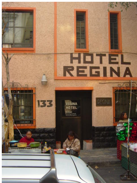
Hoteles en la Merced (Tena, 2015)