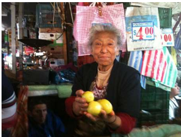
Marchanta del Mercado de La Merced (Tena, 2003)

Ir al mercado (o de plaza) constituye una práctica social muy arraigada y de alta significación por su carácter cultural (simbólico), ya que, por un lado, está relacionada con uno de los más grandes placeres: la comida, su preparación, innovación y degustación, es un lugar de inspiración de este arte que se nutre con los sentidos al recorrer pasillos y puestos, donde se precipita la memoria