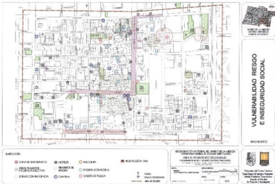
Identificación de zonas de sexo servicio y otras prácticas (Tena y Urrieta, 2009)

El sexo servicio en el barrio cuenta con el soporte del equipamiento de “hospedaje”: son un total de 29 hoteles de paso (ocho en las naves, ocho en San Pablo y 12 en la zona antigua), con diferentes escalidades y precios -desde $100, como el hotel Regina-, se rentan por tiempo (usualmente menos de media hora) y se ocupan las 24 horas -a diferencia de los hoteles para viajeros que se rentan por noche según tabuladores-; además de otros locales y casas donde se alquilan cuartos en forma clandestina.