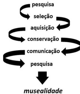
Figura 3:

Para los autores chilenos Ricardo Pérez-Luco, Leonardo Lagos, Rodolfo Mardones y Felipe Sáez (2017, p. 1116), el diseño emergente, “se construye durante el proceso de investigación en conjunto con los actores naturales del lugar de trabajo”, de allí el desprendimiento de leyes o esquemas generales rígidos, procurando facilitar la heurística propia de dinámicas flexibles que incluso se focalizan en miradas interculturales, centrando los esfuerzos de patrimonialización y posible musealización del patrimonio, atendiendo las necesidades heterogéneas y no asumiendo que todos los procesos son homogéneos o similares, pues eso sería negar que el mismo, es una construcción social, polisémica y por tanto con características singulares en cada caso.