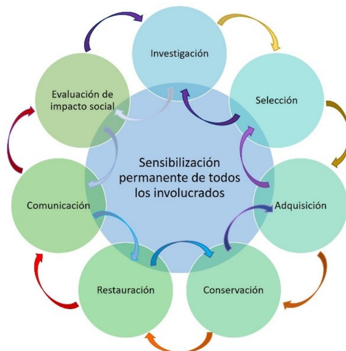
Figura 4: Gráfico de interrelaciones dialécticas para la sinergia patrimonial y museológica.

La praxis patrimonial y museística se contextualiza en lo cotidiano y no en el ideal teórico de los textos y aulas de clase, que ciertamente permiten conocer y comprender parámetros generalizados, pero el ejercicio directo en el campo, es donde se desprende lo rígido o estático para convertirse en una sinergia de dinámicas dialécticas y heterogéneas que procuran la resolución improvisada de problemas complejos de orden caótico y variado a la que se le da respuesta, conociendo de primera mano las fortalezas y debilidades presentes en la dinámica, a fin de visualizar oportunidades heurísticas que emergen en la particularidad propia del proceso, sin descuidar que los involucrados en la cadena de patrimonialización y musealización, “no tienen obligatoriamente los mismos intereses o las mismas expectativas en estos procesos” (COLIN, 2014, p. 2).