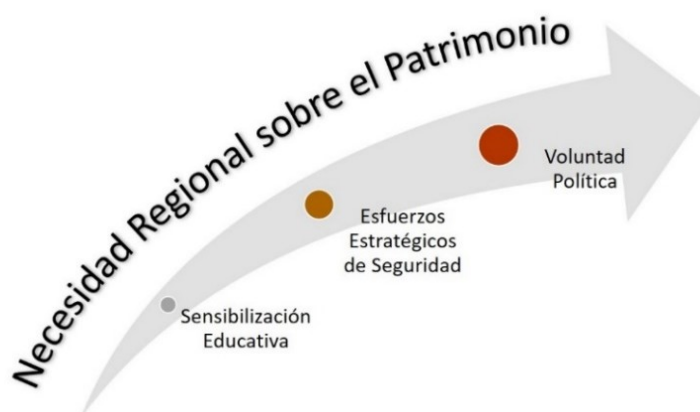
Figura 6: Proyección de los escenarios sociales actuales en busca de la interculturalidad. Fuente: Elaborado por el autor, 2022.