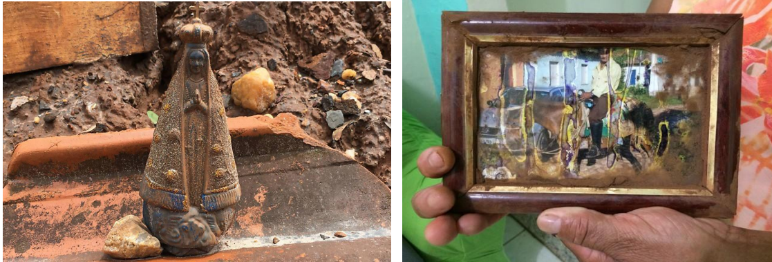
Figura 1: imagem de Nossa Senhora Aparecida encontrada na lama. Figura 2: Conceição de Paula segura a foto encontrada no meio da lama, em Bento Rodrigues (MG).

intrinsecamente ligado à dimensão valorativa que atribuímos aos objetos, nas suas conexões estabelecidas com territórios, pessoas e significados.