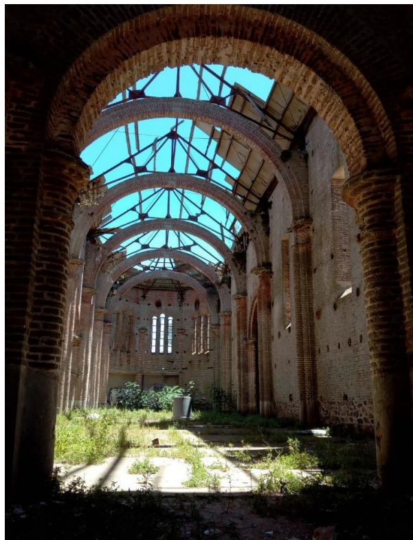
Figura 1 – Perspectiva do interior da Igreja de Piria: efeitos de luz e sombra decorrentes da perda da cobertura, presença de pátinas nas alvenarias e de vegetação.