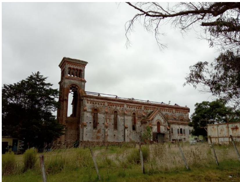
Figura 2 – Perspectiva da lateral externa da Igreja de Piria: integração da edificação com o seu entorno e presença de pátinas e lacunas na sua materialidade.