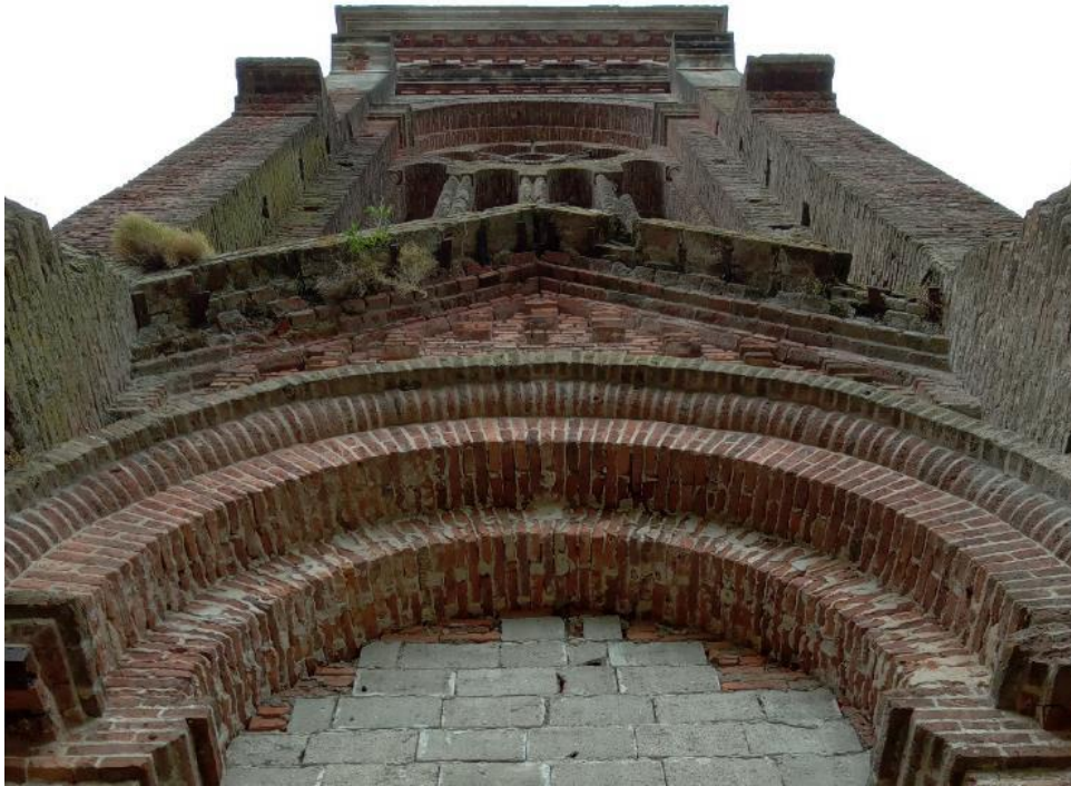
Figura 3 – Detalhe da fachada principal da Igreja de Piria: presença de vegetação e desgaste das alvenarias devido à exposição às intempéries (vento e chuva).