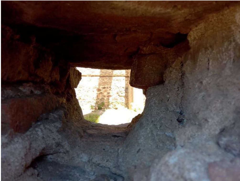
Figura 7 – Detalhe externo da Igreja de Piria: lacunas na parede da edificação, onde eram colocados os andaimes durante a obra, evidenciando a sua inconclusão.