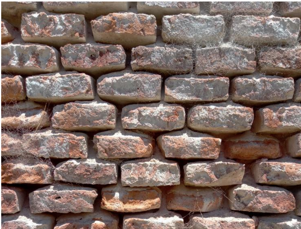
Figura 8 – Detalhe externo da Igreja de Piria: pátina do tempo manifestada nos tijolos maciços.