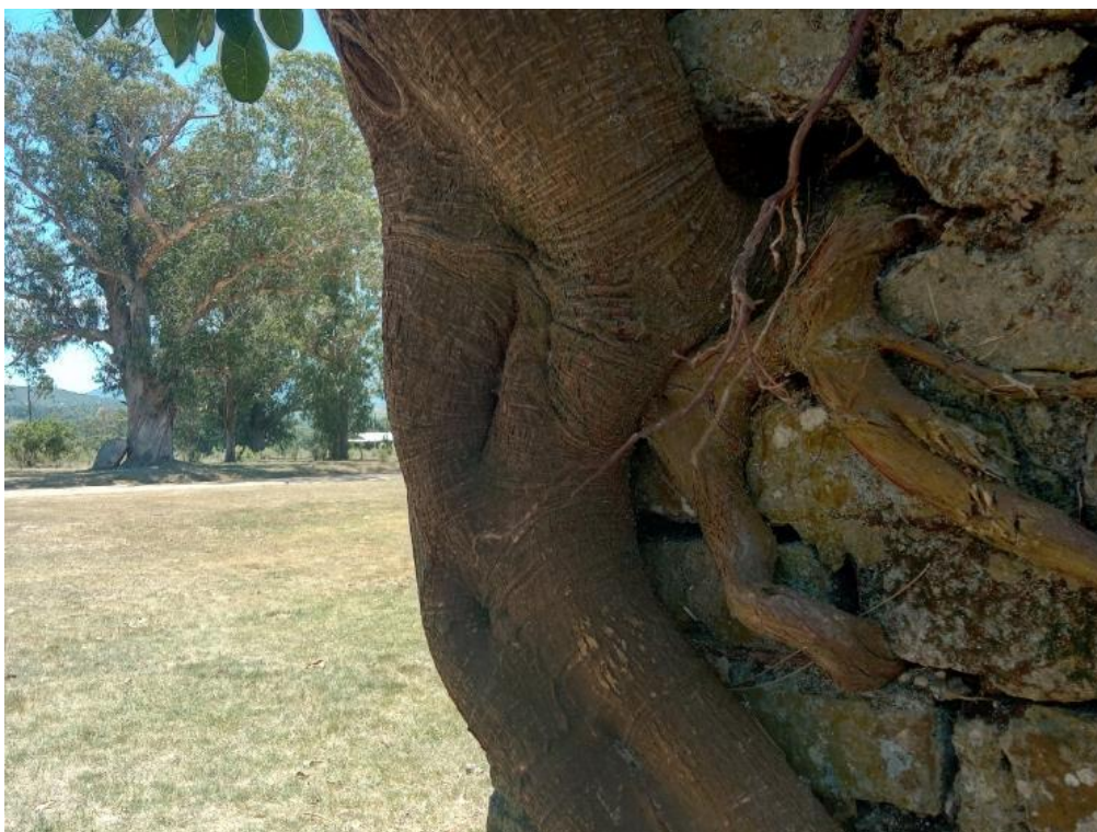
Figura 10 – Detalhe externo da Igreja de Piria: raiz de uma árvore incrustada na parede da edificação.