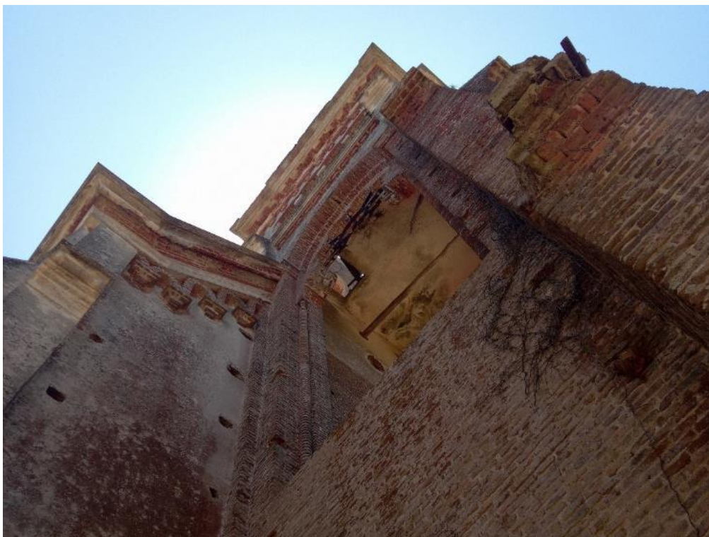
Figura 5 – Detalhe da lateral externa do campanário da Igreja de Piria: presença de vegetação e de linhas tortuosas moldadas pela chuva e pelo sol.