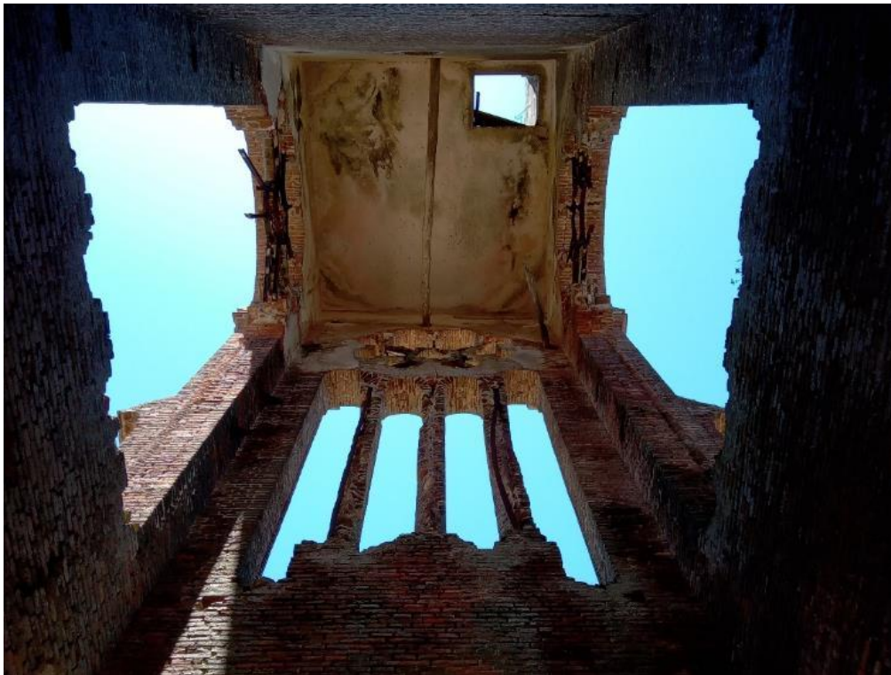
Figura 6 – Detalhe do interior do campanário da Igreja de Piria: interrupção do tecido figurativo das rosáceas e desgaste das alvenarias.