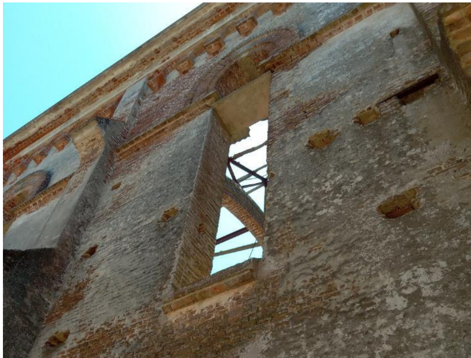
Figura 4 – Detalhe da fachada lateral da Igreja de Piria: desgaste do revestimento externo revelando as suas diferentes camadas.