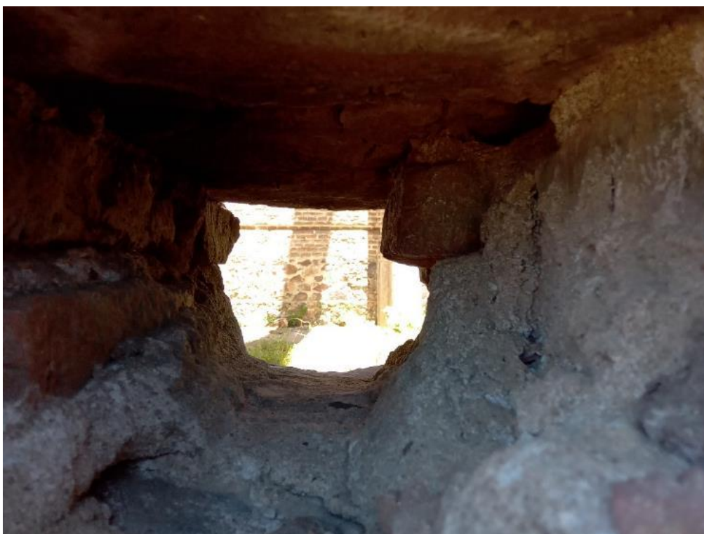
Figura 7 – Detalhe externo da Igreja de Piria: lacunas na parede da edificação, onde eram colocados os andaimes durante a obra, evidenciando a sua inconclusão.