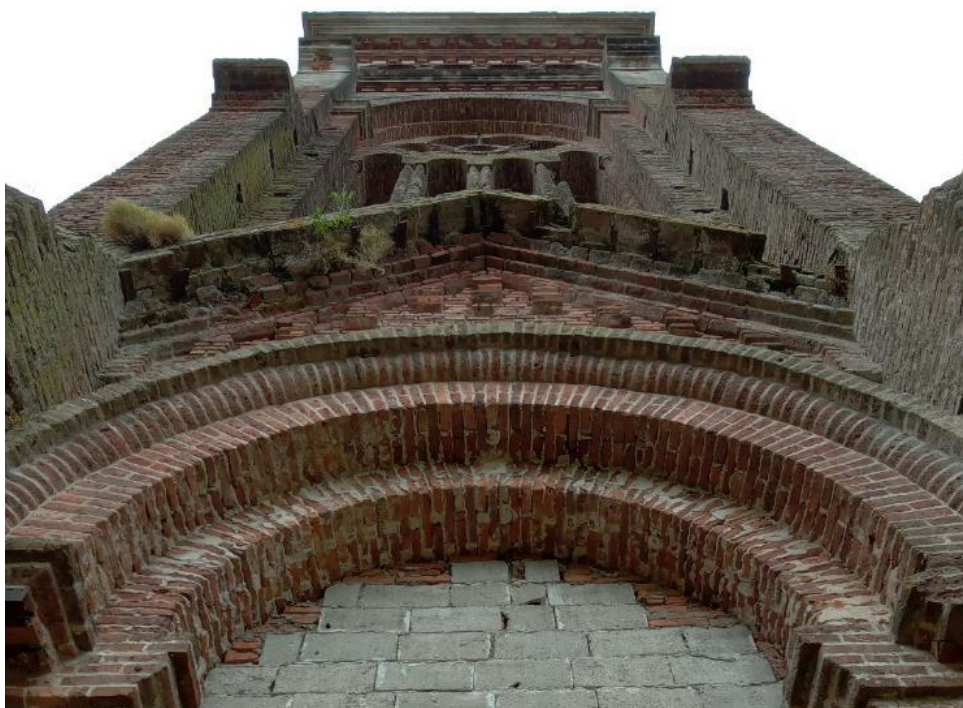
Figura 3 – Detalhe da fachada principal da Igreja de Piria: presença de vegetação e desgaste das alvenarias devido à exposição às intempéries (vento e chuva).