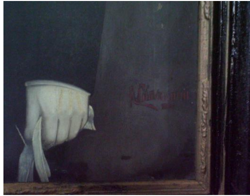
Figura 4: Detalhe. Assinatura do Artista Ricardo Giovanini.