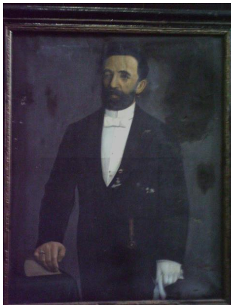
Figura 3: Barão de Vila Isabel (?). Sócio Benemérito da SPB de Rio Grande.

O artista italiano Ricardo Giovanini destaca-se nas cidades de Rio Grande e Pelotas nas décadas de 1880 e 1890, com trabalhos junto aos teatros e decoração de residências. Nos poucos registros encontrados na Sociedade Portuguesa de Beneficência de Rio Grande, percebe-se que na imagem possivelmente está representado o Barão de Santa Isabel, e a assinatura do artista é vista em tinta vermelha no espaço inferior direito da obra, conforme ilustram as figuras 03 e 04. Da mesma forma, a imagem acadêmica ilustra o seu associado benemérito, em posição frontal, com suas condecorações sob a vestimenta, e mão esquerda sobre livro, ilustrando tanto a sua boa posição social quanto cultural.