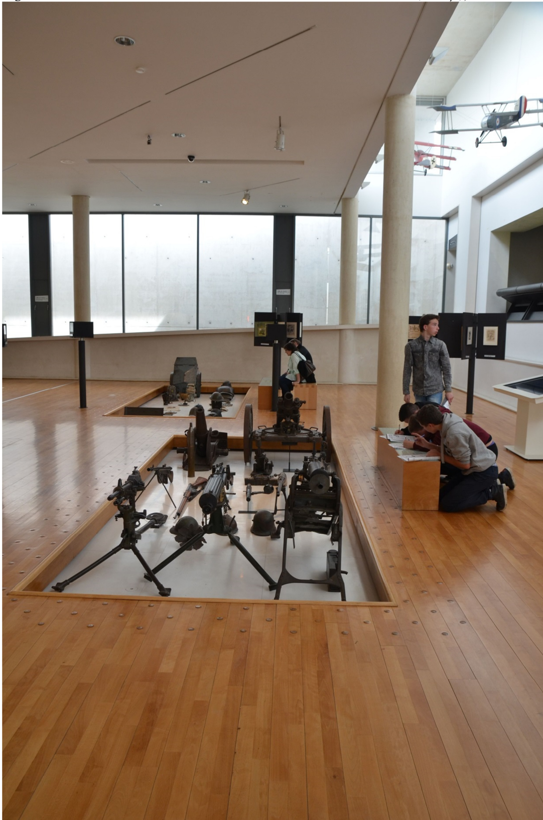
Figura 1 - Sala central do Museu Historial da Grande Guerra. Péronne (França), 2016.