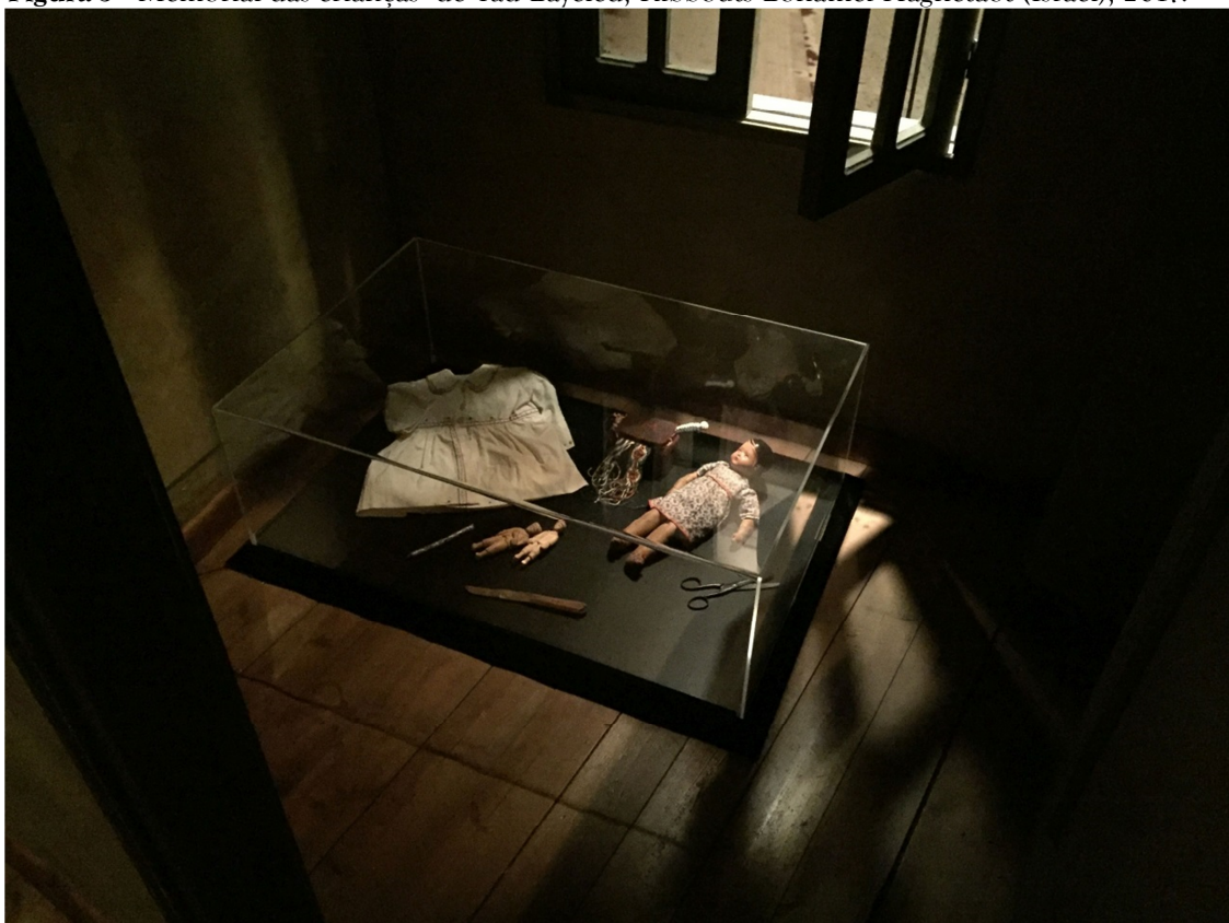
(© Philippe Mesnard)