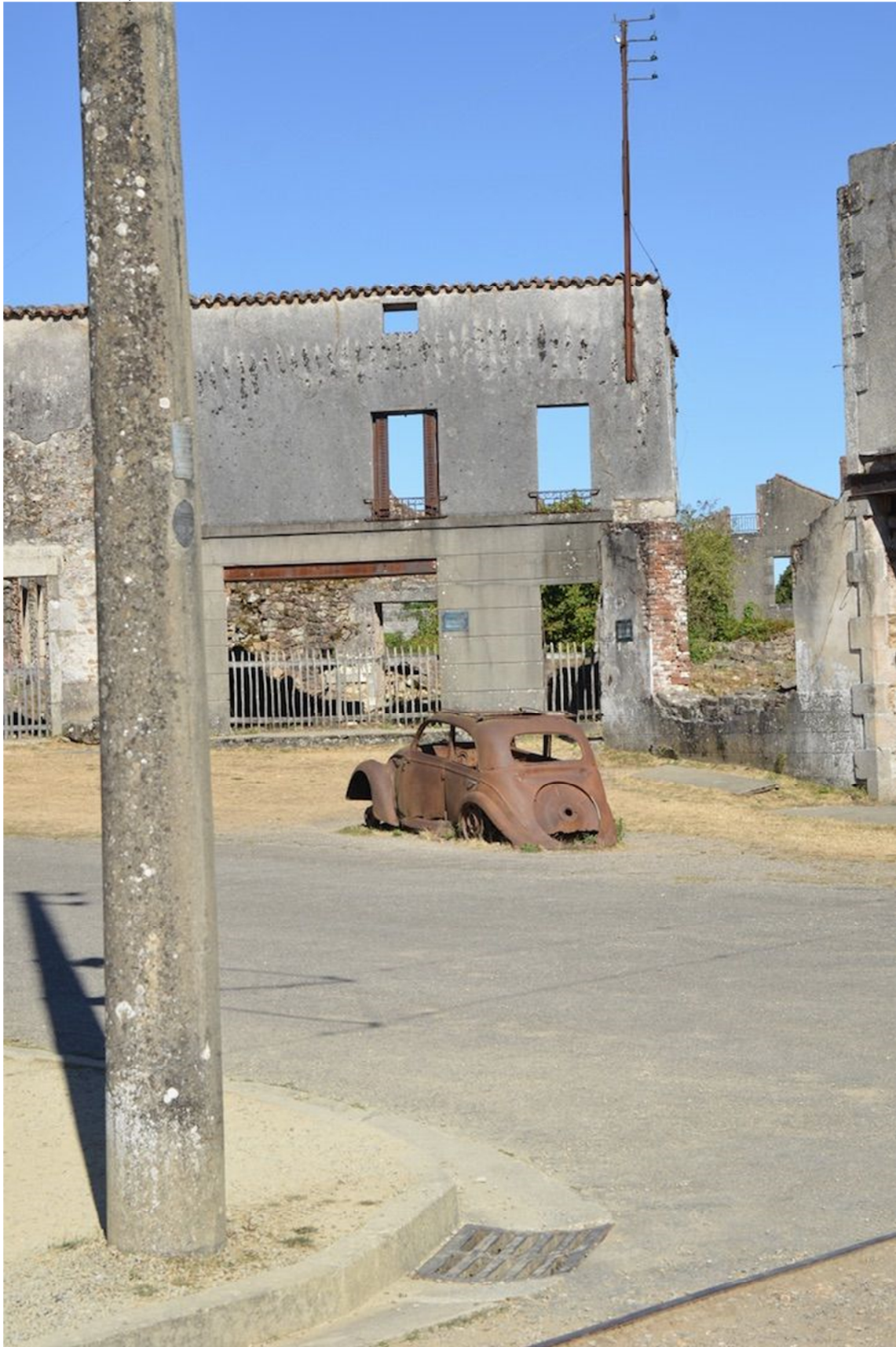
(© Philippe Mesnard)