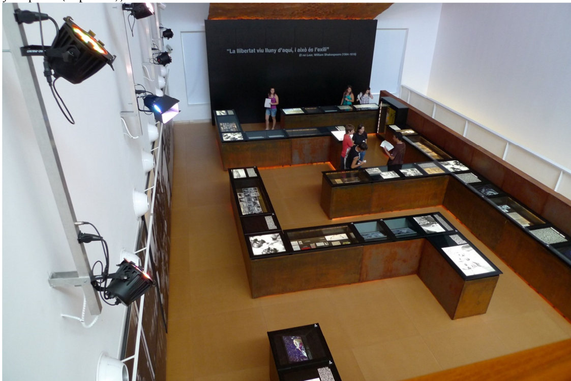
(© Philippe Mesnard)