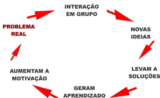
Figura 1 – Ciclo contínuo provocado pela técnica.

Ao final, cada grupo, diante do problema inicial enriquecido de alternativas, passou a focar-se na melhor solução, dentre aquelas apresentadas. Nesse momento, cada problema poderia ter oito ou mais ideias diferentes de soluções/ações. Na etapa seguinte, o primeiro grupo a analisar cada problema teve uma semana para decidir qual proposta seria apresentada à direção da suposta empresa. Esta apresentação, que deveria primar pela inovação e criatividade, constituiria um momento para a socialização de todas as sugestões e opiniões afloradas ao longo do percurso dos grupos pelas estações. A Figura 1 resume a parte empírica do trabalho proposto.