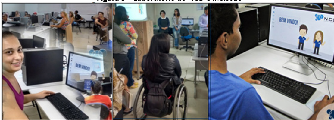
Figura 3 – Laboratório do NCD e inclusão