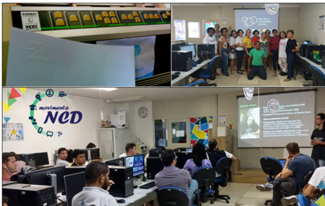
Figura 2 – NCD movimenta: um laboratório cidadão