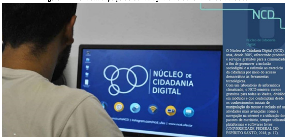
Figura 1 – NCD: um espaço de construção da cidadania e identidades

No laboratório do NCD, a comunidade usuária (9.200 usuários cadastrados; 3 mil atendimentos mensais) tem acesso a cursos, impressões e palestras.