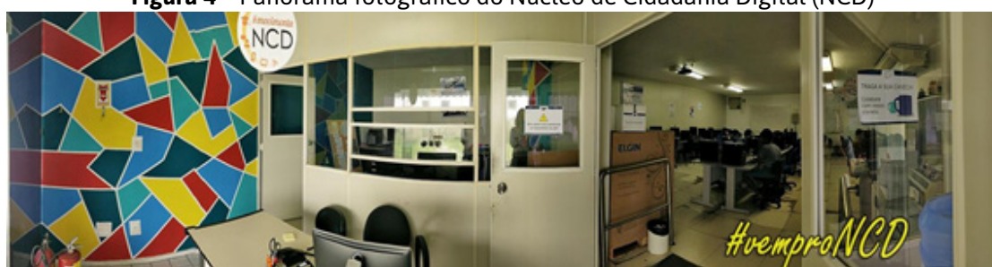
Figura 4 – Panorama fotográfico do Núcleo de Cidadania Digital (NCD)

Vitória, 2018.