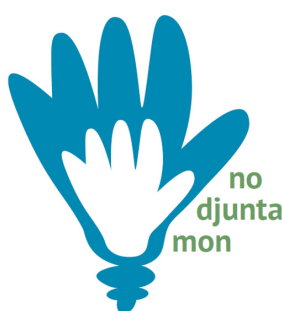
Figura 2 - Logo do Projeto No Djunta Mon .

Advindo da vivência de um dos integrantes em Guiné Bissau, o projeto No Djunta Mon - “nós nos damos as mãos” em crioulo guineense - (Fig. 2) tem o objetivo de elaborar e produzir videoaulas que são enviadas para Guiné-Bissau com intuito de auxiliar na formação de professores, possibilitando um intercâmbio de conhecimento entre o curso de Ciências Biológicas da Universidade Federal de Santa Catarina (UFSC), algumas escolas guineenses e professores de Santa Catarina, Brasil.