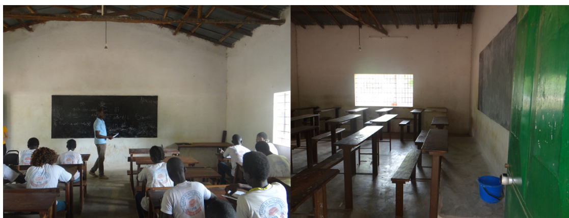
Figura 1 - Sala de aula do Liceu Gino Ambrosi em Tite, Guiné-Bissau.