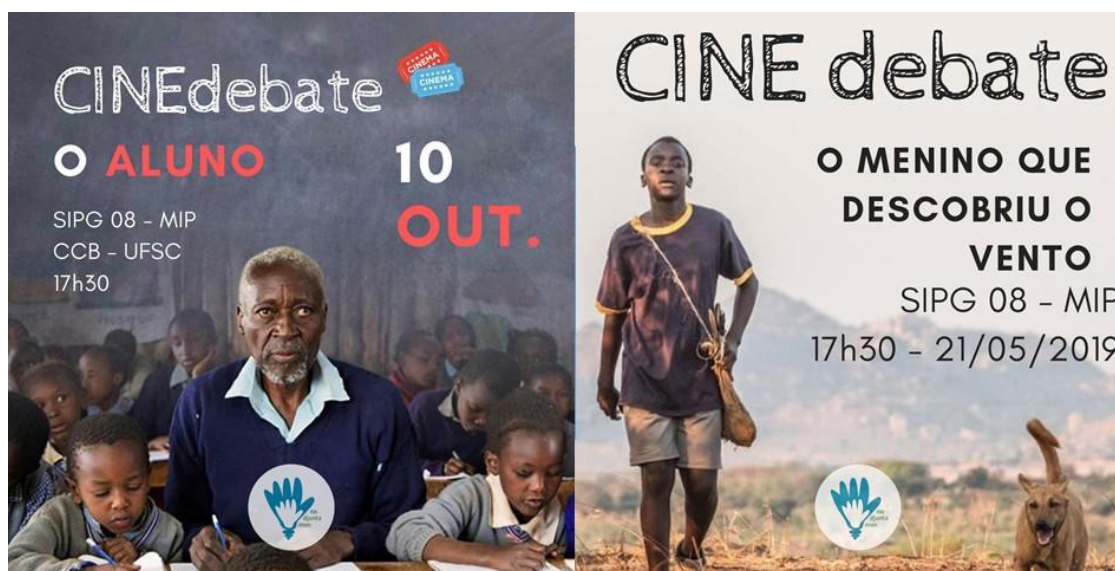
Figura 4 - Cine Debate No Djunta Mon.

africanos com similaridades nas questões políticas e socioeconômicas. Estes debates acrescentam na formação dos licenciandos de Biologia proporcionando um olhar mais preocupado com a situação social dos alunos e seu contexto, tentando incluir esta realidade na sua prática pedagógica, para torná-la mais inclusiva e efetiva.