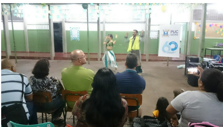
Figura 6 – Coreografia Indianos