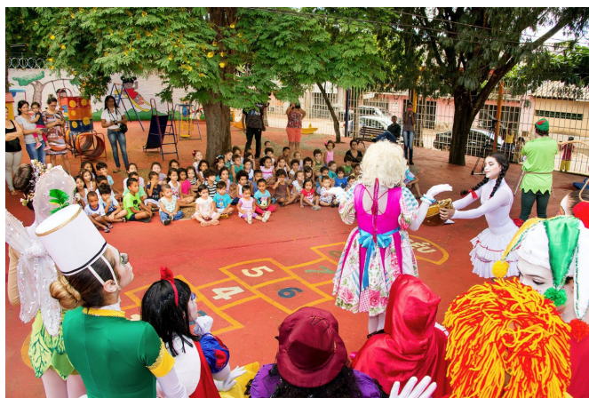
Figura 2 – O Livro Mágico

https://drive.google.com/file/d/1YzrFJreyyV3HduWepPDnZntqnO5LDWdV/view?usp=sharing