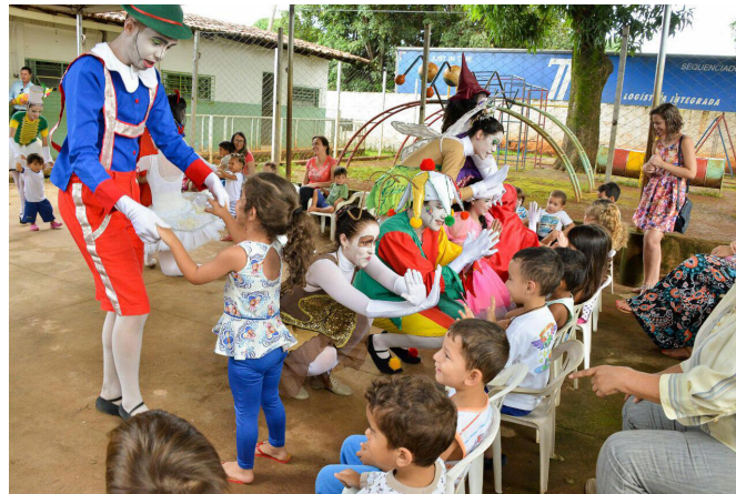
Figura 3 – O Livro Mágico