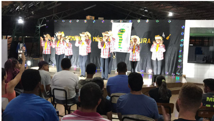
Figura 7 – Catira