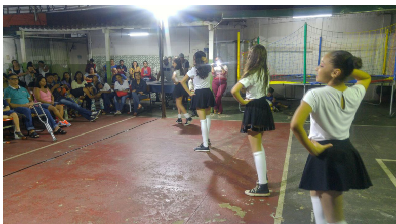
Figura 5 – Coreografia K-Pop