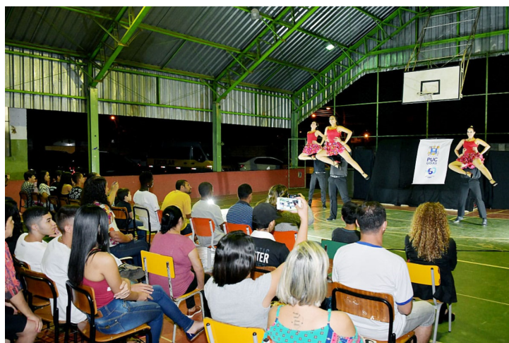
Figura 8 – Goiás é mais