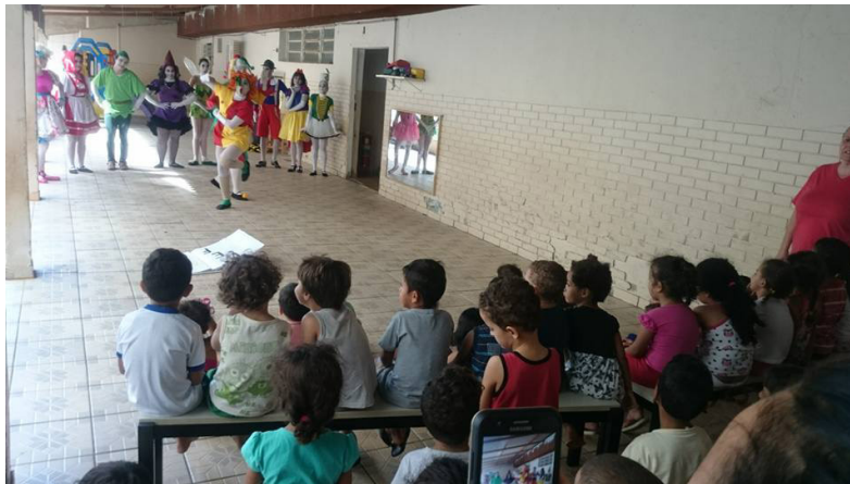
Figura 4 – O Livro Mágico