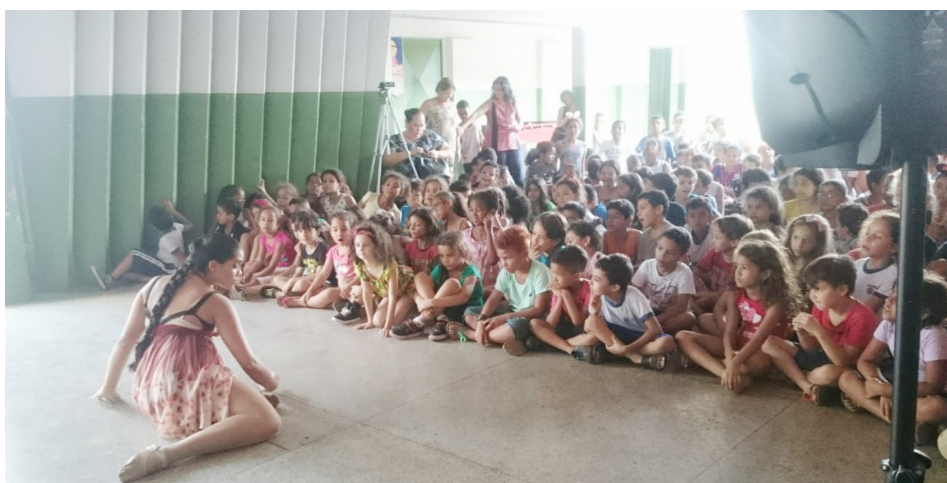
Figura 9 – Cerrado