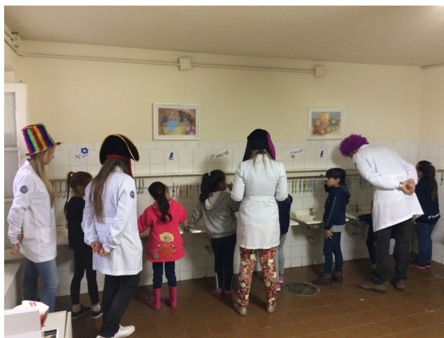
Figura 5 – Imagem dos membros da equipe, em atividades de orientação, com práticas supervisionadas de higiene oral.