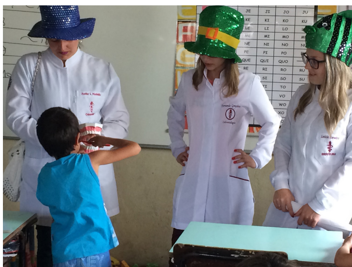
Figura 3 – Imagem dos membros da equipe executiva promovendo interação com um dos escolares, durante um exercício de prática educativa, voltada para a qualidade da higiene oral.