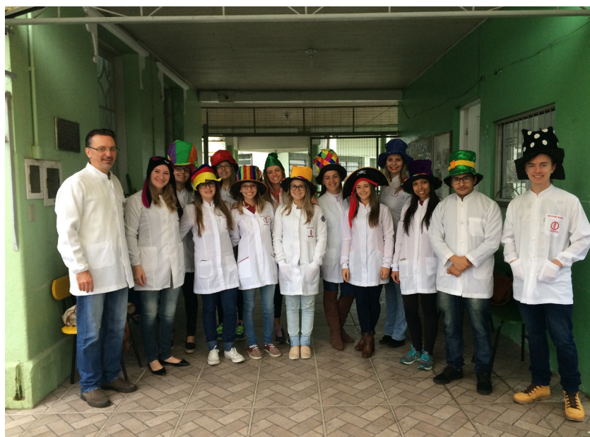
Figura 1 – Imagem dos membros da equipe executiva em uma das instituições de ensino durante a realização das ações na primeira edição do projeto realizada em 2016.