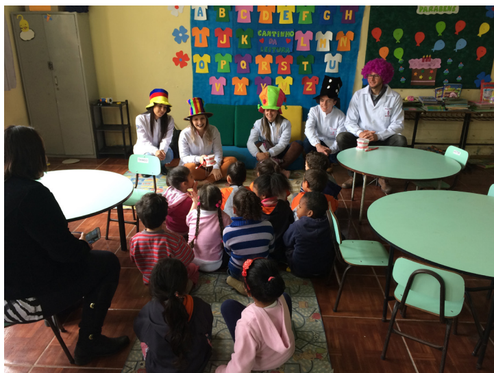
Figura 2 – Imagens dos membros da equipe executiva, promovendo interações nas escolas, com o objetivo de realizar práticas educativas diversificadas e incentivar o envolvimento de uma das professoras da instituição.