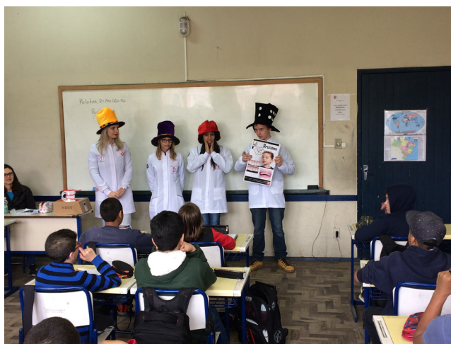
Figura 4 – Imagem dos membros da equipe usando infográficos educativos em sala de aula durante a realização de uma das ações do projeto.