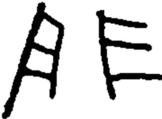
Fig. 3 – Dessin du graffiti du lécythe 916.3.16 (C. K. B. Dias)

Dans ce cas, l'inscription ne montre pas de marque de fabrication (et cela parce qu'elle n'était pas sur le pied du vase, comme cela survient normalement), et n'est pas utilisée comme information pour l'attribution.