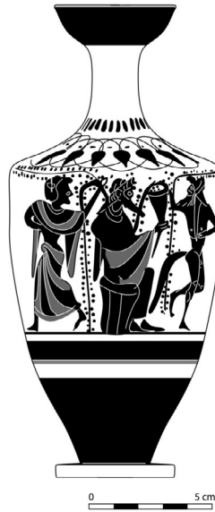
Fig. 2 – Dessin du lécythe Toronto 916.3.16 (Y. Nakas)

clairement voir que quelques traits sont différents, mais ce qui désignerait ce “style spécial” n’est pas visible, et en l’absence d’autres éléments d’analyse il ne me semble pas possible de comprendre ce que voulait dire Beazley.