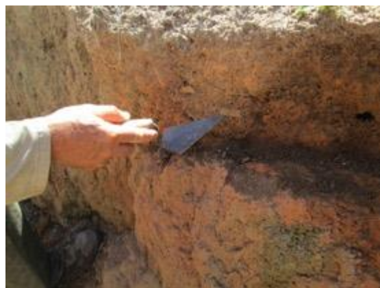
Figura 17: Três fragmentos de cerâmica no talude. . UTM (SAD 69) 23K 0315.688E / 7.473.470N. Foto extraída do Relatório de Prospecção Trecho 2 (Fonte: ECOSSIS, 2015, p. 146).