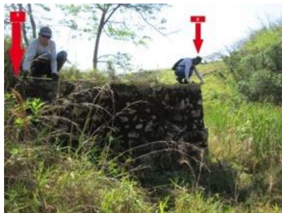
Figura 21: Lado da estrutura com pontos 2 e 3.