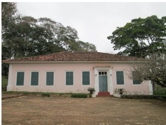
Figura 32: Parte posterior da Sede.

A Fazenda Santa Adelaide antigamente caracterizava-se pelo cultivo do café, e atualmente pela criação de gado. Ainda possui muro de pedra (coordenada (SAD69) UTM 23K 0324.358E / 7.465.960N) e, segundo relato de um antigo funcionário, na atual sede da fazenda havia uma senzala, além do terraço de secagem de café.