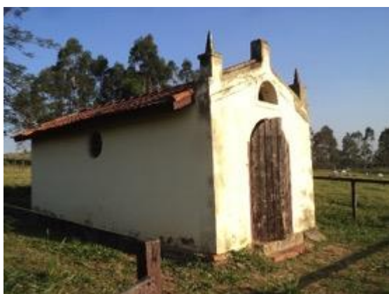
Figura 28: Vista lateral da pequena capela.

Trata-se de uma pequena igreja – capela - (coordenada (SAD69) UTM 23K 344.885E / 7.454.150N – 886 metros de altitude) situada na meia encosta com frente para vale aberto e pouco profundo. Está construída a cerca de 30m de estrada que liga Jaguariúna às propriedades rurais locais, em estado de semi-abandono. Suas dimensões são aproximadamente de 6m x 3m. Em toda a região é possível observar vários desses exemplares, importantes para a cultura religiosa local.