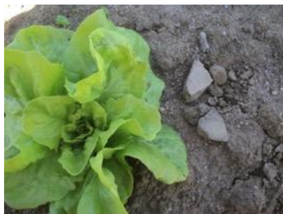
Figura 04: Dois fragmentos de cerâmica. UTM (SAD 69) 23K 0316.713E / 7.472.926N. Foto extraída do Relatório de Prospecção Trecho 2 (Fonte: ECOSSIS, 2015, p. 154).