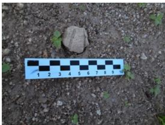
Figura 03: Fragmento de cerâmica. UTM (SAD 69) 23K 0316.699E / 7.472.965N. Foto extraída do Relatório de Prospecção Trecho 2 (Fonte: ECOSSIS, 2015, p. 152).

As concentrações de material encontram-se apenas em superfície, cuja área tem 5.393,3 m 2 e também deverá ser alvo de resgate arqueológico futuro.