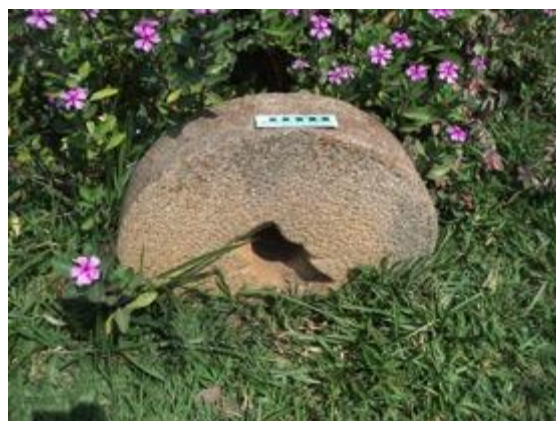
Figura 08: Pedra de moinho. Foto extraída do Relatório de Prospecção Trecho 2 (Fonte: ECOSSIS, 2015, p. 124).