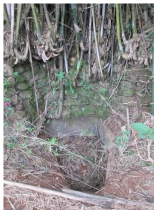
Figura 33: Muro de pedras. Foto extraída do Relatório de Prospecção Trecho 2 (Fonte: ECOSSIS, 2015, p. 108).