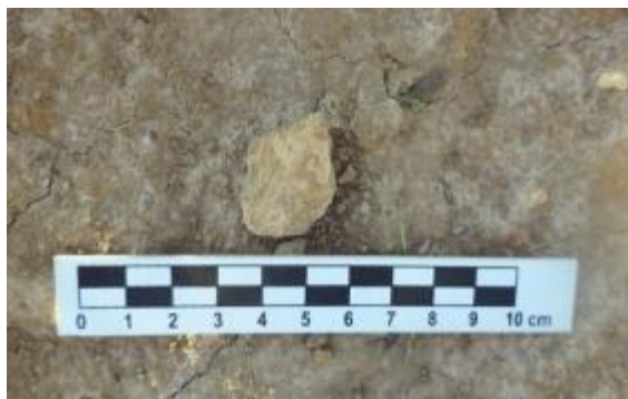
Figura 26: Ocorrência de cerâmica.