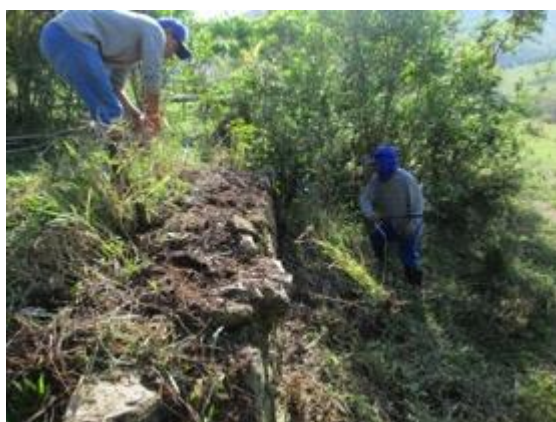
Figura 14: Limpeza do arrimo.

Foram registrados tijolos e fragmentos de tijolos dispersos, sendo partes do piso original e uma ruína de arrimo com 3,20 metros de comprimento, 0,85 metros de altura e 0,50 metros de espessura. A técnica de sua construção é de empilhamento por junta seca. Nenhuma estrutura próxima foi correlacionada a esta estrutura em tijolos, não podendo ser determinada uma data.