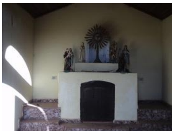
Figura 29: Vista interna da Capela. Foto extraída do Relatório de Prospecção Trecho 2 (Fonte: ECOSSIS, 2015, p. 104).