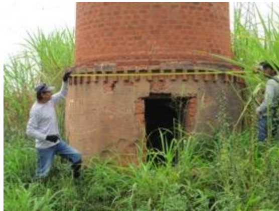
Figura 06: Medição da base da chaminé. UTM (SAD 69) 23K 0258.367E / 7.7512.543N. Foto extraída do Relatório de Prospecção Trecho 2.