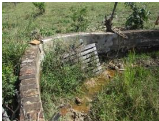
Figura 13: Vértice arredondado da barragem. As técnicas construtivas são recentes.