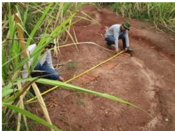
Figura 18: Base em tijolo maciço (3,20m x 0,40m). UTM (SAD 69) 23K 0249.622E / 7.519.964N. Foto extraída do Relatório de Prospecção Trecho 2 (Fonte: ECOSSIS, 2015, p. 157).