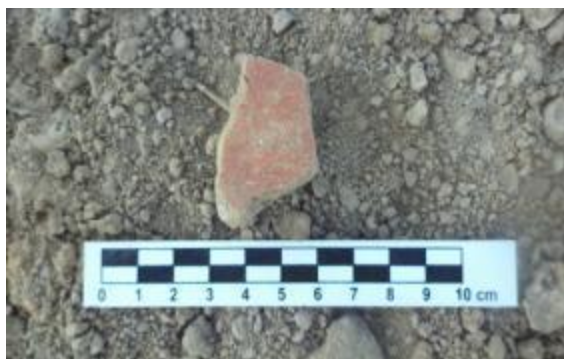
Figura 09: Ocorrência de cerâmica.

Foram registrados os pontos com material disperso em toda a área, tendo como área estimada (devido ao canalial alto, sem permissão de retirada do mesmo) de 10.427 m 2 , utilizando-se de caminhamento sistemático.