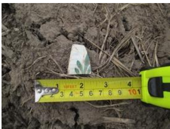
Figura 22: Fragmento de louça. UTM (SAD 69) 23K 0424.027E / 7.447.911N. Foto extraído do Relatório de Prospecção Trecho 3.

Optou-se pela delimitação utilizando-se os quatro pontos de registro de material superficial, mais distantes entre si, o que resultou em uma área de 1.253 m 2 .