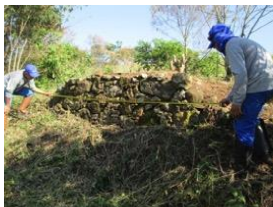
Figura 15: Medição do arrimo (3,20m).