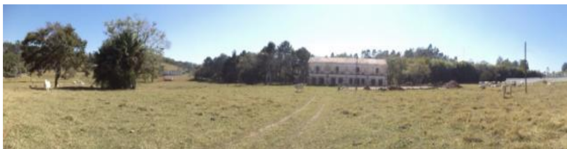
Figura 11: Vista panorâmica da tulha.

Foi classificada, como de interesse histórico, muito provavelmente por estar associada à histórica Fazenda Bom Retiro, que parece ter sido construída com tijolo maciço e cimento, com área de 487,7 m 2 .