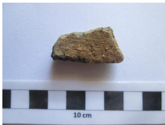
Figura 25: Fragmento de cerâmica. UTM (SAD 69) 23K 0424.790E / 7.447.819N. Foto extraído do Relatório de Prospecção Trecho 3 (Fonte: ECOSSIS, 2015, p. 93).