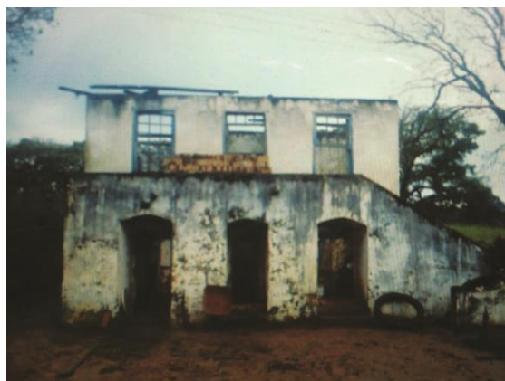
Figura 31: Foto da casa sede antes da reforma, fornecida pelo Sr. Rodrigo. Foto extraída do Relatório de Prospecção Trecho 2 (Fonte: ECOSSIS, 2015, p. 106).