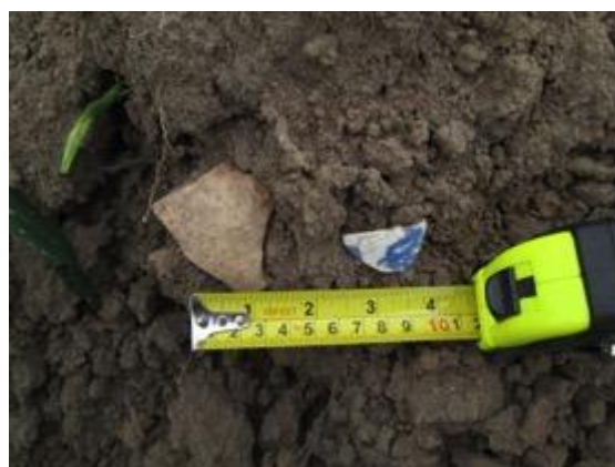
Figura 23: Fragmento de cerâmica e louça. UTM (SAD 69) 23K 0424.024E / 7.447.908N. Foto extraído do Relatório de Prospecção Trecho 3.