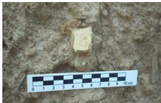
Figura 27: Ocorrência de cerâmica.