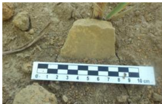
Figura 10: Ocorrência de cerâmica. Foto extraída do Relatório de Prospecção Trecho 2 (Fonte: ECOSSIS, 2015, p. 129).