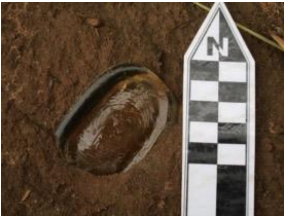
Figura 05: Fragmento de vidro. UTM (SAD 69) 23K 0258.413E / 7.512.600N. Foto extraída do Relatório de Prospecção Trecho 2.

A chaminé está na baixa encosta, em um relevo predominantemente suave ondulado, ao lado de um caminho interno, no limite de um talhão de cana-de-açúcar. No seu entorno é possível observar fragmentos de vidro e louça, em uma área de 1.026 m 2 , que inclui a chaminé e o material disperso em superfície.