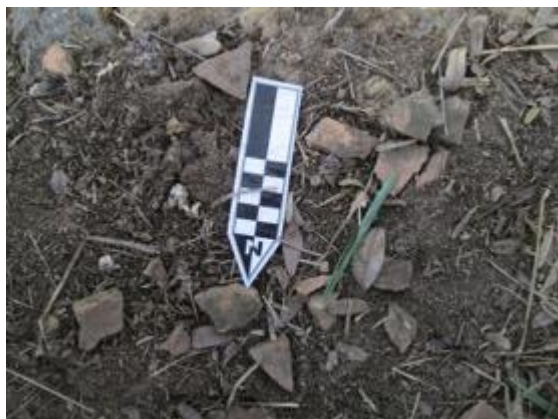
Figura 20: Fragmentos de cerâmica recente. UTM (SAD 69) 23K 0299.721E / 7.481.860N.