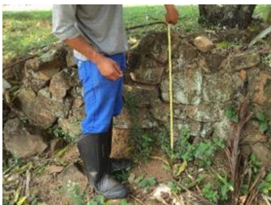
Figura 07: Medição de muro de pedra. Foto extraída do Relatório de Prospecção Trecho 2 (Fonte: ECOSSIS, 2015, p. 124).

A área foi calculada com cerca de 1.003,2 m 2 , localizado nas coordenadas UTM (SAD69) 0270.380E / 7.503.305N.