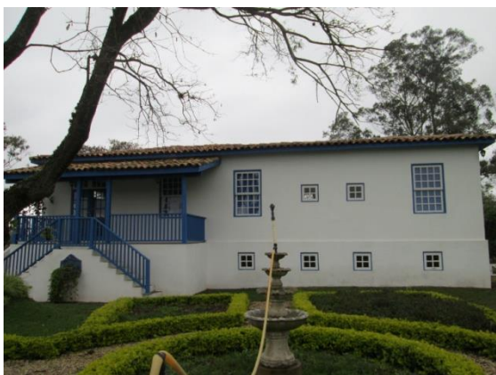
Figura 30: Vista frontal da casa sede.

Trata-se de uma pequena sede de fazenda (coordenada (SAD69) UTM 23K 327.436E / 7.465.820N) situada na meia encosta, no município de Morungaba-SP. Possui a casa sede, celeiro transformado em escritório, casa de colono, terreiro de secagem de café e paiol. Na frente da sede encontra-se a data de 1882, referente à fundação da casa. Possui 3 quartos, 2 banheiros, 1 cozinha e senzala. Pertencia anteriormente à Fazenda Lajeado.