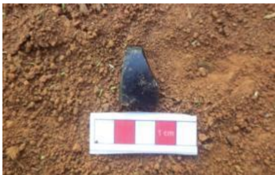
Figura 01: Fragmento de vidro. Foto extraída do Relatório de Prospecção (Fonte: ECOSSIS, 2014, p. 216).

As concentrações de material encontram-se apenas em superfície, cuja área tem 900 m 2 , e deverá ser alvo de resgate arqueológico futuro.