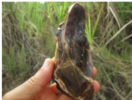
Figura 19: Artefato em silixito. UTM (SAD 69) 23K 0249.434E / 7.519.827N. Foto extraída do Relatório de Prospecção Trecho 2 (Fonte: ECOSSIS, 2015, p. 157).