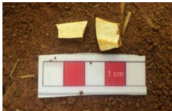
Figura 02: Louça. Foto extraída do Relatório de Prospecção (Fonte: ECOSSIS, 2014, p. 216).