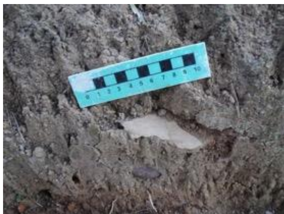
Figura 16: Fragmento de cerâmica no talude. UTM (SAD 69) 23K 0315.675E / 7.473.482N.

As sondagens realizadas durante a delimitação do sítio resultou positivo (02 fragmentos de cerâmica e 01 fragmento de vidro a 20 cm de profundidade na Sondagem Central - coordenadas UTM (SAD 69) 23K 0315.693E / 7.473.486N). Relacionado a isto, foi registrada a presença de fragmentos de cerâmica, em profundidade em mais de um ponto do talude da estrada rural citada. De modo geral, esses fragmentos não estão em profundidade maior do que 30 cm. Calcula-se uma área de 2.237 m 2 .