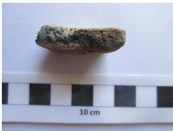
Figura 24: Fragmento de cerâmica. UTM (SAD 69) 23K 0424.790E / 7.447.819N. Foto extraído do Relatório de Prospecção Trecho 3 (Fonte: ECOSSIS, 2015, p. 93).

Foram identificados 2 fragmentos de cerâmica (na verdade 1 fragmento, dividido em dois com a ferramenta no processo de rebaixamento da sondagem). Isto se deu na Sondagem Direita 20m. A partir desta constatação, a sondagem positiva foi definida como Sondagem Central e outras oito sondagens foram abertas com o objetivo de melhor investigar a subsuperfície, também a título de se implantar a delimitação, caso viesse confirmar sítio arqueológico no local. Todas as sondagens tiveram resultado negativo e a cerâmica registrada na Sondagem Direita 20m foi considerada como uma ocorrência fortuita, nas coordenadas UTM (SAD 69) 23K 0424.790E / 7.447.819N, em altitude 619 m.