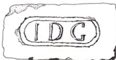
Figura 11: Tijolo, Monograma I D G, Coleção Casa do Grito. Desenho ilustrativo: Carla V. Pequini, 2018.