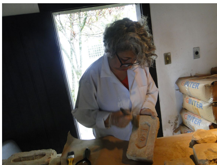
Figura 4: Higienização dos tijolos. Foto. Angélica A. M. Da Silva, 2017.