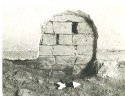
Figura 2: Parede de tijolos da Casa do Grito. Foto: Wilson Weigl. Relatório de atividades arqueológicas na Casa do Grito. Acervo CASP.

Durante as escavações da Casa do Grito, ocorridas entre agosto e outubro de 1981, além de 207 tijolos 6 , foram identificados azulejo, argamassa, cerâmica, couro, louça, madeira, metal, mineral, moeda, osso, semente, tecido, telha, valvas de molusco, vidro e na categoria diversos (dentre eles 17 são ‘plásticos’ e 4 são ‘borrachas’). Ou seja, 21 polímeros, entre eles fragmentos de botões, brinquedos e pentes de cabelo, reforçando a afirmação já apresentada sobre os polímeros, ainda pouco estudados pela arqueologia. Outros materiais na categoria ‘diversos’ são fragmentos de botões de roupa em metal, osso e madeira, vidro e carvão para análise. Grande parte dos plásticos saíram da camada entre 0-25 cm nomeada ‘entulho-nivelamento’. O carvão para análise foi identificado a 55 cm de profundidade.