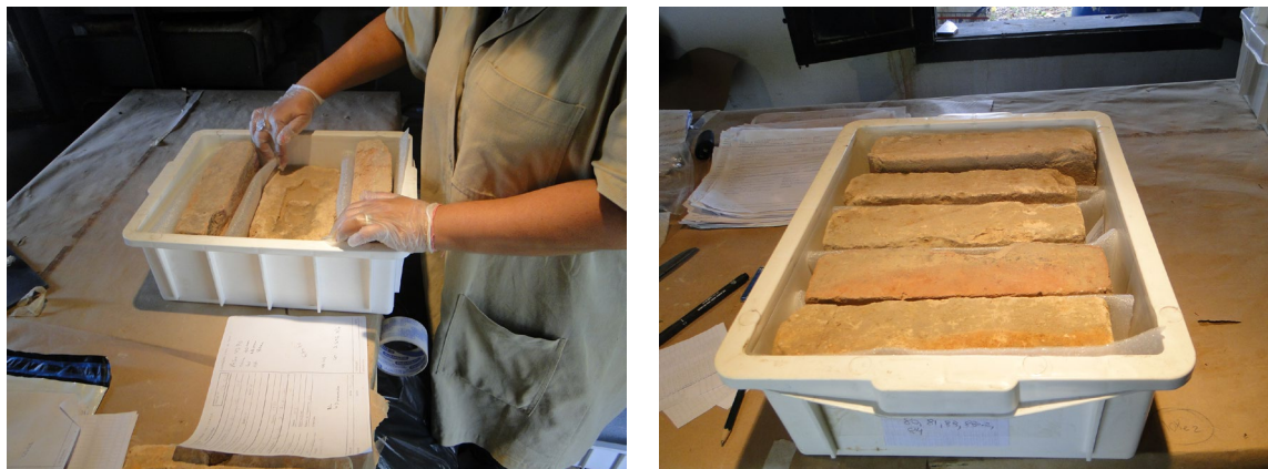
Figuras 7 e 8: Acondicionamento dos tijolos. Foto. Angélica A. M. Da Silva, 2017.

Inicialmente os tijolos da coleção Casa do Grito estavam armazenados em caixas plásticas marrom de maior dimensão e foram trocadas por menores na cor branca. A proposição do CASP para a troca das caixas deve-se principalmente ao tamanho. As caixas anteriores, por serem maiores, embora comportem mais tijolos, não são práticas e são inadequadas do