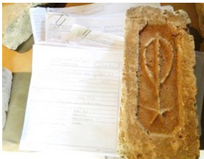
Figura 3: Conferência: Tijolo e ficha de inventário da peça. Foto. Angélica A. M. Da Silva, 2017.

O CASP possui a documentação gerada a partir das escavações realizadas na Casa do Grito e foi utilizada a versão digital das fichas do inventário de peças para fazer a conferência. Feita a conferência das fichas com as peças correspondentes, de 207 tijolos mencionados no Relatório de Atividades (ANDREATA, 1981) foram identificadas 163 peças. São 116 fichas para os 207 tijolos mencionados no Relatório, onde cada ficha faz menção a mais de uma unidade de fragmentos de tijolos da mesma marca (entendidos como fragmentos tanto as peças íntegras quanto as fraturadas) retirados do mesmo local e camada – para os quais foram dados à época o mesmo número de registro. Assim, foram identificados 163 tijolos relativos a 102 fichas. Outras 14 fichas ficaram sem a identificação dos tijolos correspondentes, que podem estar entre os tijolos sem acrônimo e que serão identificados e reagrupados quando da organização total do acervo.