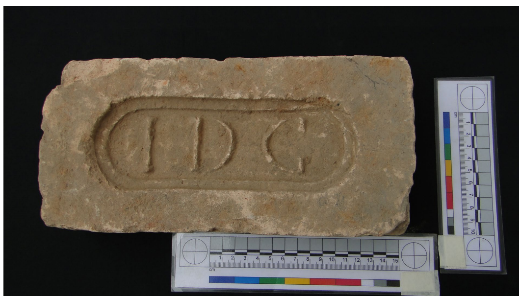
Figura 9: Tijolo, inscrição I D G, Coleção Casa do Grito.

Para o acondicionamento dos tijolos nas caixas, para proteção das peças contra atrito foi utilizada manta de EPE – espuma de polietileno expandido de 2mm de espessura. Foram cortadas tiras de 1,40m x 0,30 cm e aplicadas entre as peças, no fundo da caixa e abas sobre os tijolos na superfície da caixa.