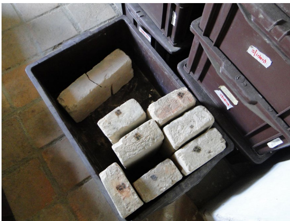
Figura 6: Secagem da tinta nanquim. Foto. Angélica A. M. Da Silva, 2017.

incolor. Contudo, não foi possível afirmar de que material se tratava, por não haver documentação referente a isso. A escrita foi realizada em tinta nanquim.