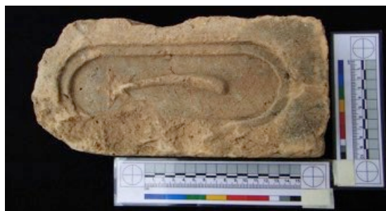
Figura 14: Tijolo, referência ao Cometa Halley, 1910. Coleção Sítio Morrinhos. Acervo CASP.