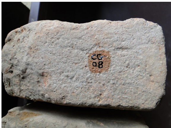
Figura 5: Detalhe do acrônimo + número de registro marcados na superfície lateral do tijolo. Foto. Angélica A. M. Da Silva, 2017.

Na curadoria original feita pelo Laboratório de Restauro do Departamento do Patrimônio Histórico (DPH), o número de registro das peças, ou seja, o acrônimo acompanhado da numeração sequencial dos tijolos: “CG-01; CG-02; CG-03...” foi escrito nas peças tendo como preparo da superfície uma camada de solução incolor ou tipo de verniz, que pode ter sido esmalte