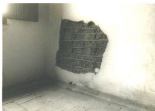
Figura 1: Parede de pau a pique da Casa do Grito. Foto: Wilson Weigl. Relatório de atividades arqueológicas na Casa do Grito. Acervo CASP.

Os estudos de arqueologia histórica em São Paulo, tiveram início com o Programa de Arqueologia Histórica no município de São Paulo iniciado em 1979 com atividades desenvolvidas até 1992 a partir de um contrato de colaboração estabelecido entre o Museu Paulista da Universidade de São Paulo e o Departamento de Patrimônio Histórico da Prefeitura de São Paulo, onde a direção das pesquisas ficou à cargo da arqueóloga Prof. a Dra. Margarida Davina Andreatta. Esses estudos arqueológicos objetivavam subsidiar projetos de restauro das edificações consideradas de relevância histórica para a cidade. A Casa do Grito é uma das casas históricas contempladas por esses estudos, tendo sido também alvo desse programa de pesquisa a Casa do Tatuapé, o Sítio Mirim, o Sítio Morrinhos, a Casa do Itaim Bibi, o Solar da Marquesa, a Casa nº 1 e o Beco do Pinto.