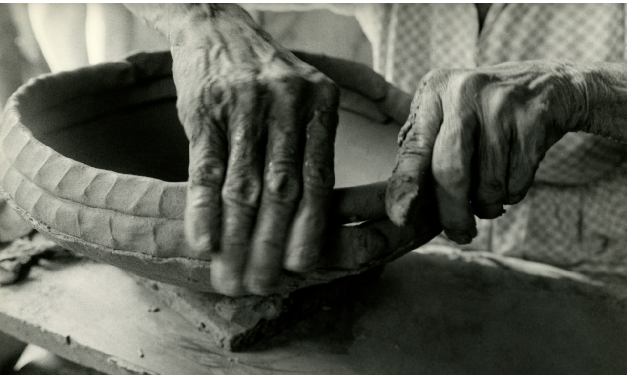
Ana Pereira unindo roletes (Jairê, Iguape)