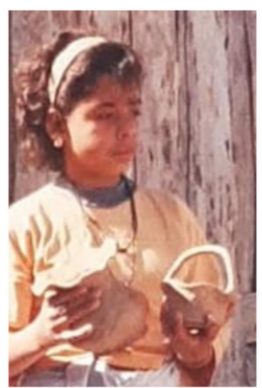
Mulheres ceramistas, por Mayy Koffler

SALLUM, Marianne; NOELLI, Francisco Silva; KOFFLER, Mayy. Mulheres indígenas e afrodescendentes e a produção de cerâmica paulista nas fotografias de Herta Löell Scheuer, Plácido de Campos Júnior & Mayy Koffler.