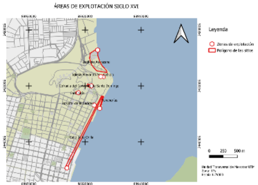
Ilustración 2 - Áreas de explotación en el Siglo XVI (DELGADO, 2023, p. 136).

De acuerdo con Bryan, en 1570 (ilustración 2), se registraban 333 esclavos en las ciudades portuarias costeras de Guayaquil y Popayán, compuestos por 216 hombres y 117 mujeres, y para el año 1600, esta cifra ascendió a 1.000. Los esclavizados en Popayán se enfocaban principalmente en la búsqueda de oro en los ríos y arroyos de la zona, mientras que los de Guayaquil satisfacían la alta demanda de sirvientes, carpinteros, aserradores, leñadores y constructores navales (BRYAN, 2005, p. 8). En el año 1605, la población de Guayaquil se componía de 1.771 indios, 331 hispanos y 353 negros, entre los cuales los últimos conformaban el 14,5% de la población esclavizada de Guayaquil, aunque se contabilizaban 20 negros libres, de los cuales 17 eran solteros y tres estaban casados (GARAY, 2010, p. 59).