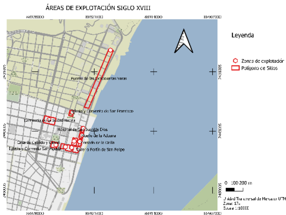
Ilustración 4 - Áreas de explotación en el Siglo XVIII. Elaborado por Génesis Delgado.

La demografía de Guayaquil en el siglo XVIII continuó su tendencia al crecimiento, con un incremento significativo en el número de habitantes. Hacia finales del siglo XVII, la ciudad ya contaba con una población de 7.962 habitantes, una cifra considerable para la época. Sin embargo, en el siglo XVIII, este número experimentó un notable aumento, llegando a 13.700 habitantes. Estos datos demográficos indican un crecimiento constante en la población de Guayaquil, lo que a su vez tuvo un impacto significativo en su desarrollo económico, social y político (GÓMEZ, 2017, p. 84).