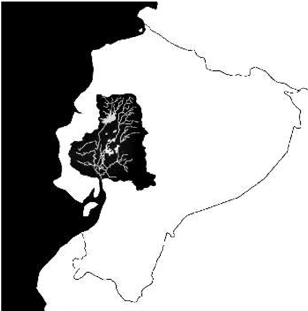
Ilustración 1 - Mapa del Ecuador con las vías navegables dentro de la cuenca del Guayas.

Guayaquil, ubicada en la costa oeste de Ecuador (ver Ilustración 1), destaca como un epicentro de importancia histórica y diversidad cultural. No obstante, un análisis más detenido de su historia revela una complejidad notable. Fundada en tiempos coloniales, la ciudad se convirtió en un núcleo de comercio y explotación, especialmente en lo que respecta al tráfico de personas esclavizadas de África y de la diáspora. La ubicación estratégica de Guayaquil como puerto en el río Guayas y su acceso al Océano Pacífico impulsaron su desarrollo económico, aunque esto acarreó un elevado costo humano.