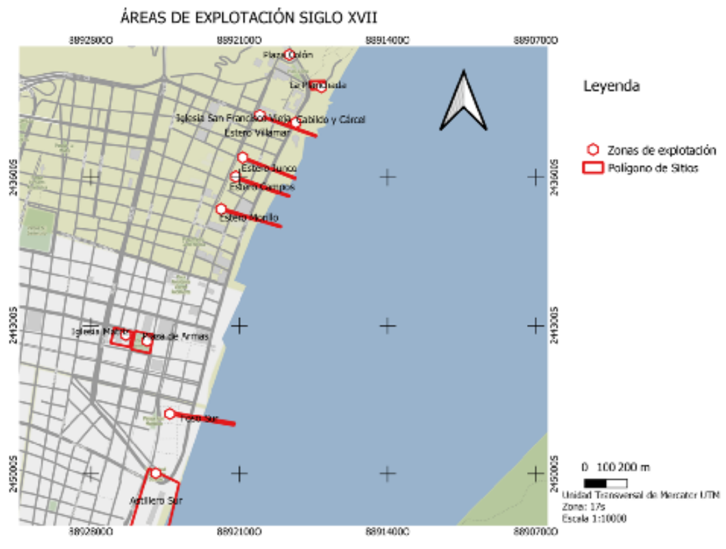
Ilustración 3 - Áreas de explotación en el Siglo XVII (DELGADO, 2023, p. 138).

En el centro de la ciudad, en particular el hospital, es un caso destacado en la historia de la época (GARAY, 2010). En el contexto jesuita, el 11 de mayo de 1645, se aprobó la venta de dos mulatos, Nicolás y Jorge, por parte del Cabildo, quienes utilizaron el producto de esta transacción para financiar la reconstrucción del hospital, conocido originalmente como el Hospital de Santa Catalina en 1564. Documentación de archivo revela que los negros también desempeñaron un papel significativo en las operaciones del hospital, como se evidencia en otras ciudades coloniales de mediados del siglo XVII y en las décadas posteriores, donde el personal encargado de cuidar a los pacientes estaba compuesto por esclavizados pertenecientes al Cabildo (TARDIEU, 2006, pp. 169).