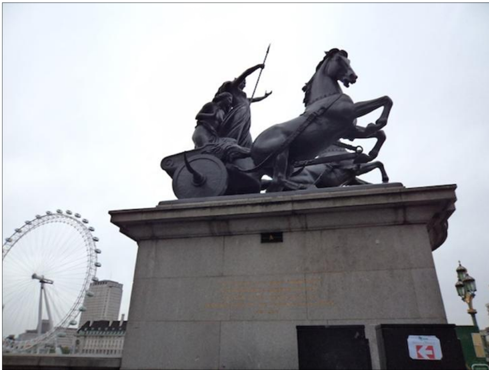
Figura 01: Estátua de Boudica em Londres (BÉLO, 2012)

suficiente para o banho final de bronze, de modo que a prefeitura de Londres precisou formar um comitê público para a arrecadação de verbas para terminá-la. Os principais donatários foram membros da realeza inglesa, acadêmicos, jornalistas, políticos e ricos senhores galeses (HINGLEY, 2000; PINTO, 2011). Esses últimos pareceram reconhecer Boudica muito mais como uma figura bretã do que inglesa. Eles próprios, mais tarde, homenagearam a guerreira em Cardiff, País de Gales, com outra estátua (PINTO, 2011).