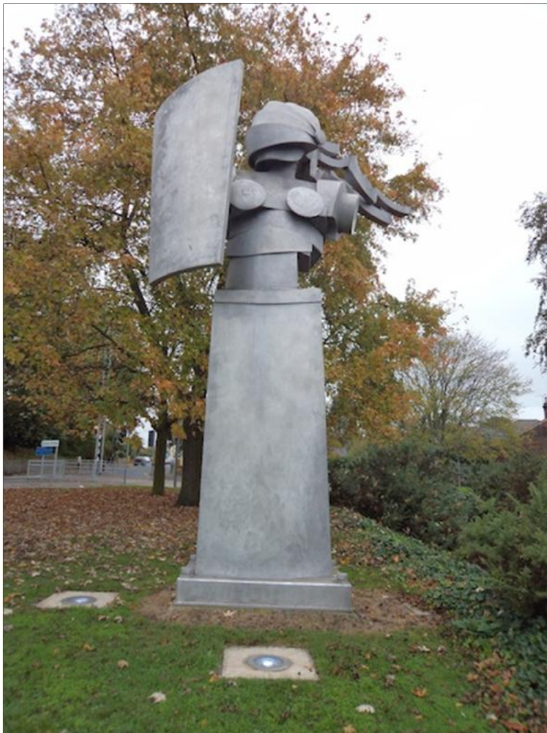
Figura 03: Estátua de Boudica em Colchester (BÉLO, 2012)

A estátua dessa cidade foi feita pelo artista Jonathan Clarke, em alumínio, no ano de 1999, e colocada próxima à rotatória da estação de trem de Colchester. Sua construção foi encomendada pelo tradicional supermercado britânico ASDA, no mesmo período em que estava sendo comprado pela rede norte-americana Walmart , sob duras críticas nacionalistas (PINTO, 2011).