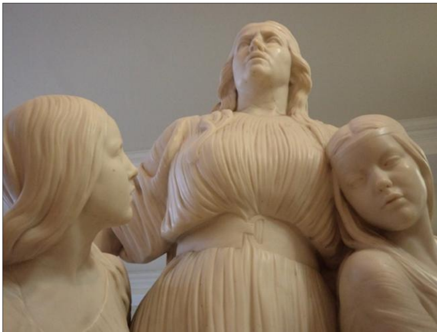
Figura 02: Estátua de Boudica em Cardiff (BÉLO, 2012)

Boudica é a única heroína dentre outros heróis, assim como algumas santidades, oficiais de guerras napoleônicas, reis medievais, poetas e líderes que se rebelaram contra o controle inglês. A construção dessa estátua a aponta como um símbolo de resistência a um inimigo, seja ele romano ou inglês. A importância dessa figura para os galeses pode estar relacionada ao fato de que estes apoiaram o término da estátua de Londres (PINTO, 2011).