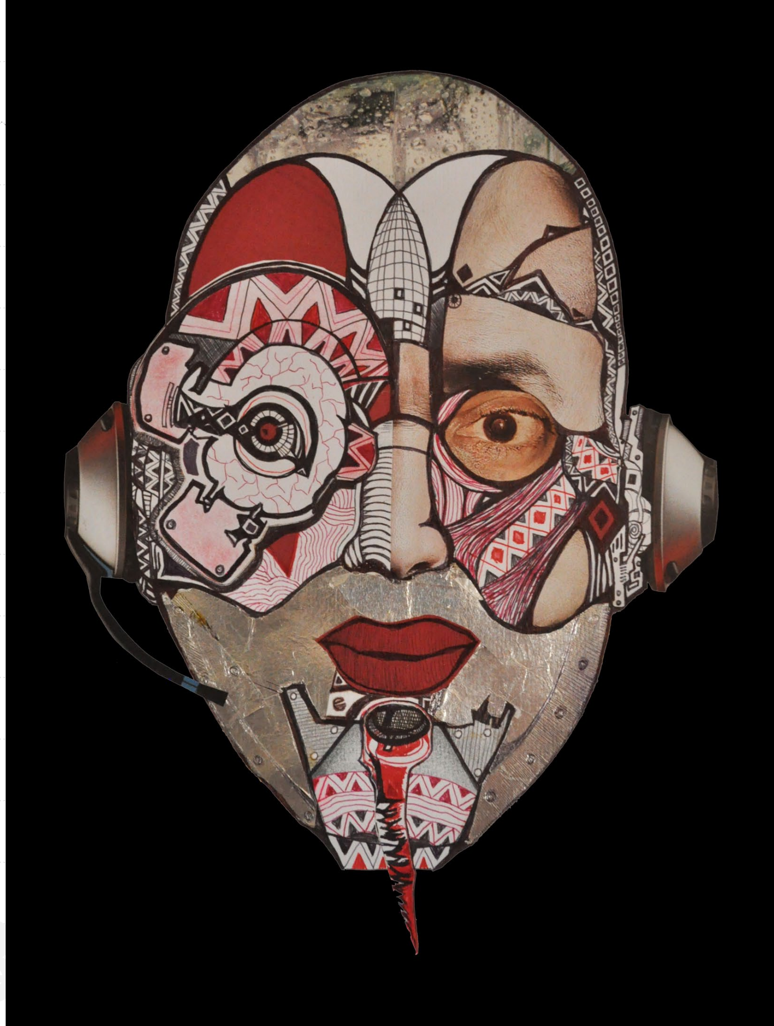
Mauro Bruschi, Cibertrônico low tech I , colagem sobre papel, 2016.