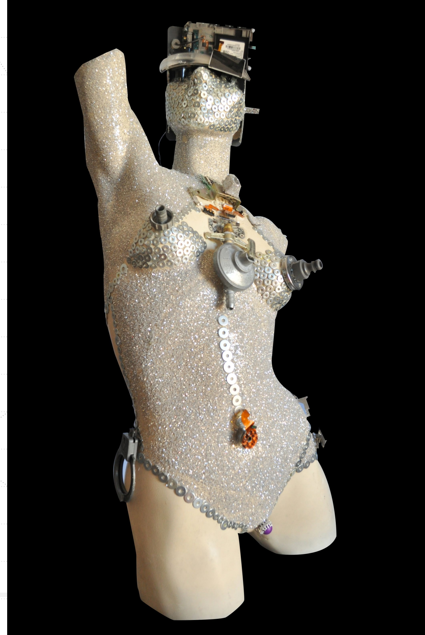
Mauro Bruschi. Ginoide I . Objeto. 2017.

Neste sentido, o campo de interação entre antropologia, artes e animismo tecnológico é terreno fértil para o desenvolvimento de investigações estéticas e poéticas. As obras inquietantes apresentadas, por Bruschi, atentam para o risco de distopias e acirramento de desigualdades; fazem bascular um ideal estanque de humanidade e interrogam sobre as formas de produção, consumo e descarte vislumbradas por proezas tecnológicas.