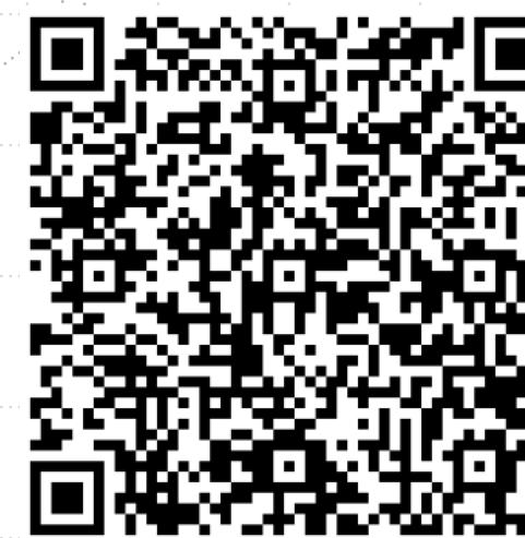
Colonização Cibernética , Mauro Bruschi, 2017.

de máquinas e mídias obsoletas, sucatas e dejetos eletrônicos retirados das ruínas da sociedade de consumo. Reterritorializados e bricolados em ateliers low tech , configuram seres abjetos pertencentes a um reino híbrido de criaturas anacrônicas que respondem ao apelo de Didi-Huberman (2017, p. 206): “é preciso instituir os restos: tomar nas instituições o que elas não querem mostrar - o rebotalho, o refugo, as imagens esquecidas ou censuradas - para retorná-las a quem de direito, quer dizer, ao ‘público’, à comunidade, aos cidadãos.”