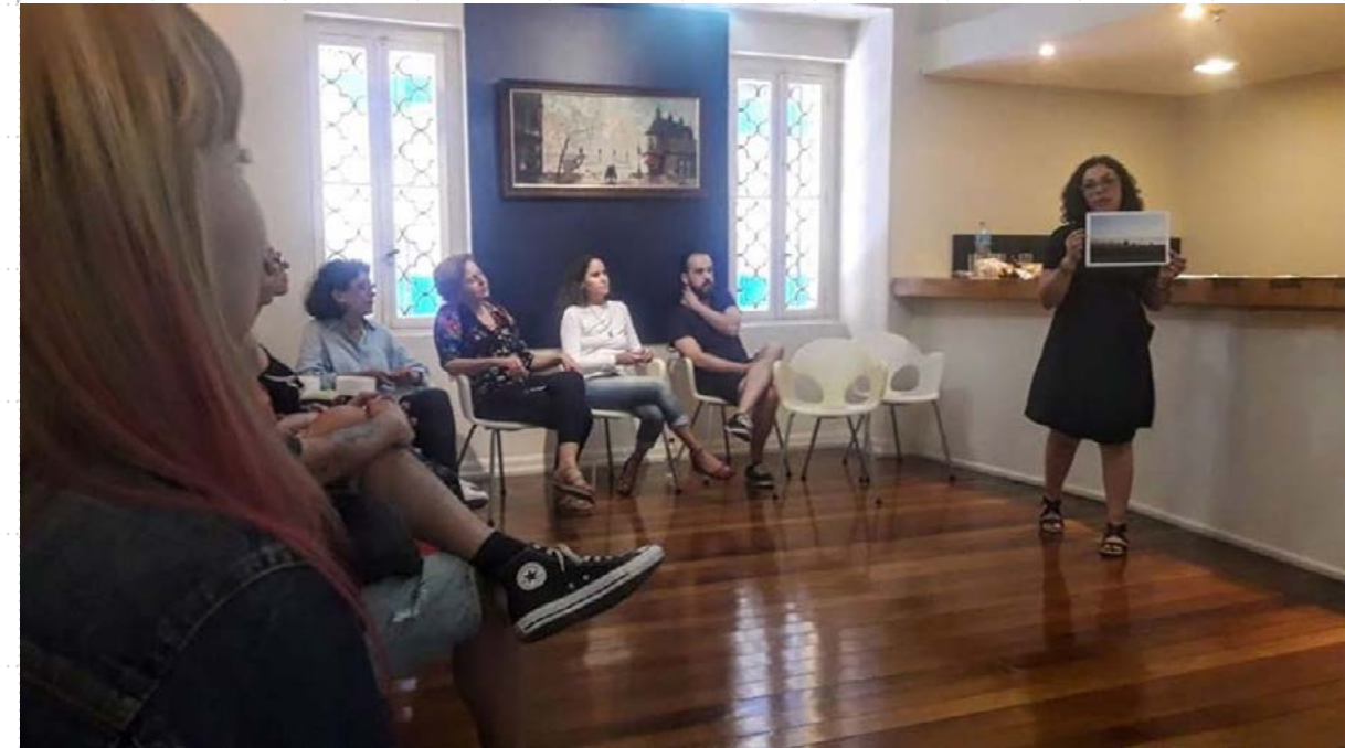
Figura 9. Rutas /Rotas (2019) montaje dialogado. Centro Cultural Erico Verissimo.