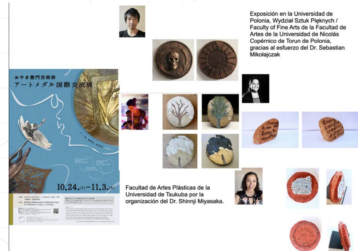
Figura 10. Documentación sobre las medallas de los profesores, así como el cartel de difusión de la Universidad de Tsukuba.

en el mes de julio, la cual se encuentra disponible en el portal de la Universidad convocante con las diez piezas conformadas para el proyecto por parte de la Facultad de Artes. Las medallas se produjeron con madera, cerámica, resinas, piedra, materiales orgánicos naturales, materiales reciclados.