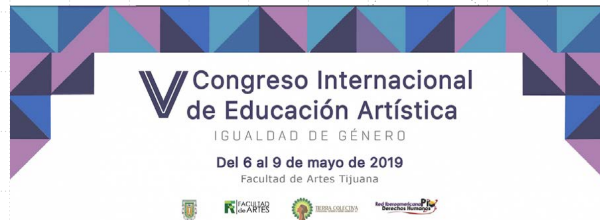
Figura 3. Cartel de último congreso (2019).