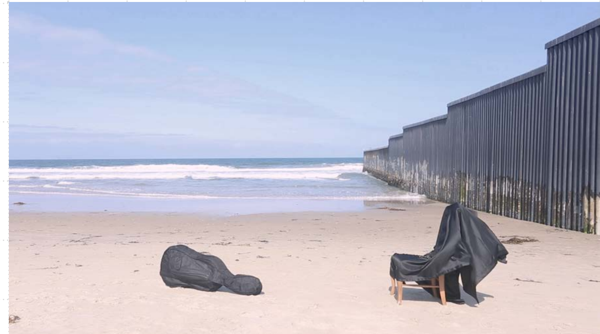
Figura 1. Documentación de la pieza Diálogos. Pieza interdisciplinaria en movimiento con visualidad contemporánea 2016.

en violonchelo incluyendo la coreografía realizada en el muro que desemboca hacia la playa de Tijuana 10 . Dicho muro es la división entre ambos países México y Estados Unidos instalada por este país norteamericano. Se presentó una colaboración interdisciplinaria además de fungir como tutora de este proyecto, realicé la documentación de la interpretación in situ y el video para su uso y disfrute durante el concierto.