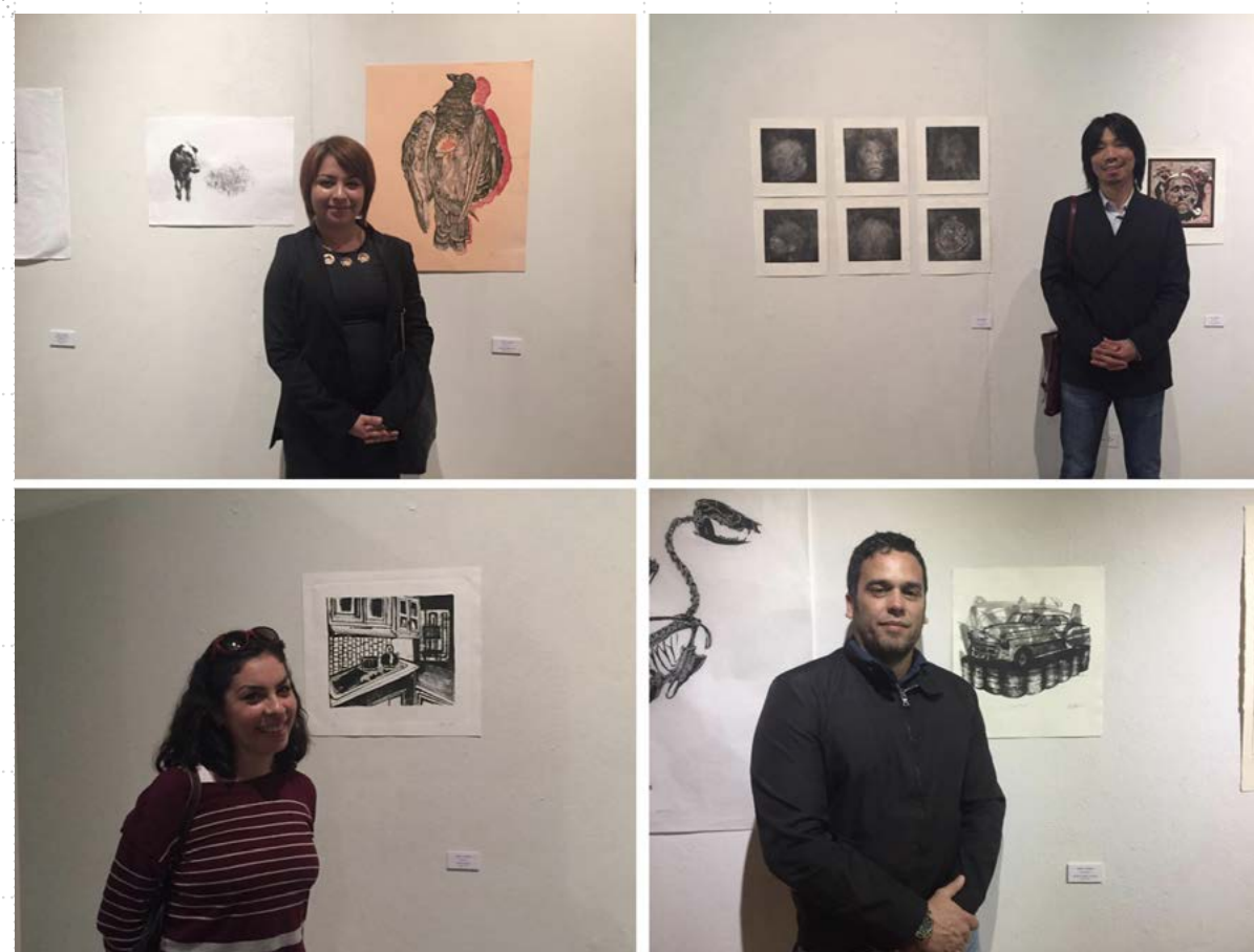
Figura 6. Documentación de la exposición Gráfica Internacional (2017), con cada integrante del CA y las obras que realizaron con la técnica de Litografía.

El objetivo de esta muestra es integrar obra de los profesores de la Facultad así como de otras universidades del país y en vinculación con Japón y Brasil. El responsable de esta exposición es el Mtro. Teruaki Yamaguchi encargado de la difusión, así como el acervo de las piezas y las gestiones para el traslado, documentación, etc.