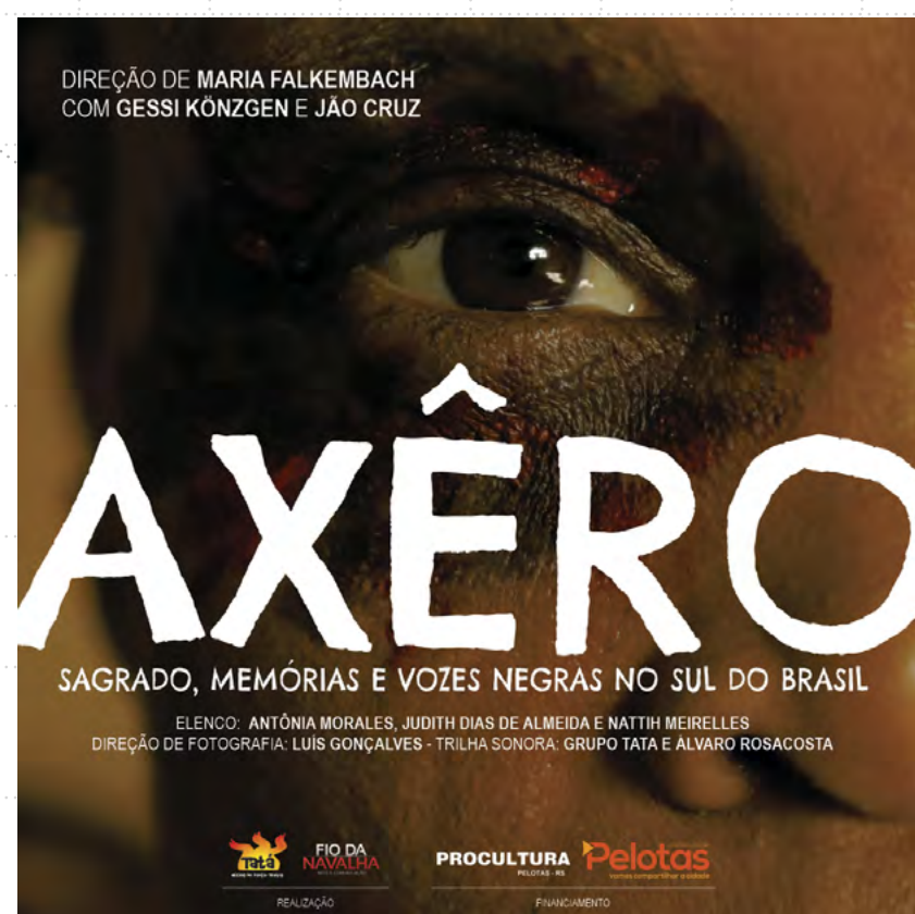
Figura 1: Pôster de Axêro - o filme.