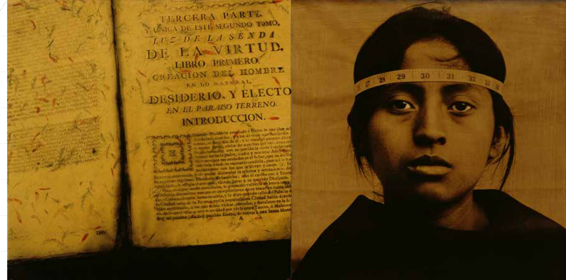
Figura 6: La Mirada Crítica (1998), Luis González Palma.

Desde o seu início, meu trabalho tem sido uma reflexão sobre o olhar. Como os olhos que nos olham fixamente são construídos em nossa experiência interna? Como as sombras, o brilho e toda a geografia implícita em cada fotografia são interpretadas e elaboradas dentro de nós? Se nosso modo de ver é feito a partir do social e do cultural, podemos concluir que todo olhar é político e que toda produção artística está sujeita a esse julgamento. O olhar como poder. A partir daí, posso sentir que a obra de arte é uma possibilidade de demonstrar isso, de questionar nossa forma de ver, questionar a história que produziu todas essas graduações do olhar e, portanto, nossas formas de reagir ao mundo. Em meu processo artístico tenho procurado criar imagens que convidam ao exame por meio do que eu chamo de "contemplação emocional", dando através de sua beleza o sentido de sua forma. Ao longo dos anos tenho construído cenários e alterado certos rostos para criar imagens que permitam outras percepções de mundo, outras formas de compreendê-lo e modificá-lo internamente (PALMA, sd, sp).