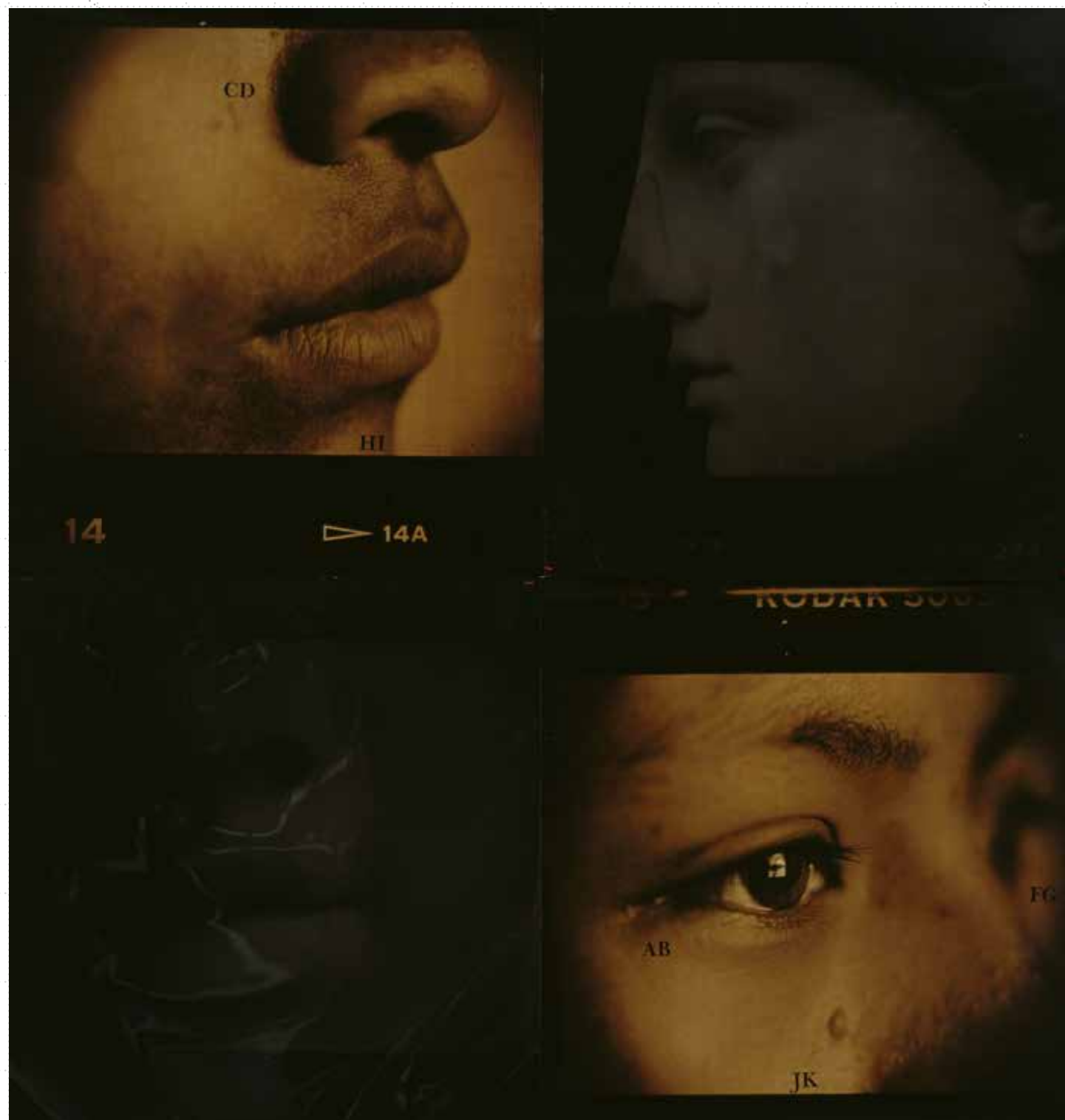
Figura 4: El Reflejo (1998), Luis González Palma.