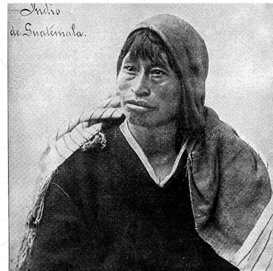
Figura 5: Indígena de Guatemala , Anônimo. Fonte: Darío González, Geografía de la América Central , 1896.