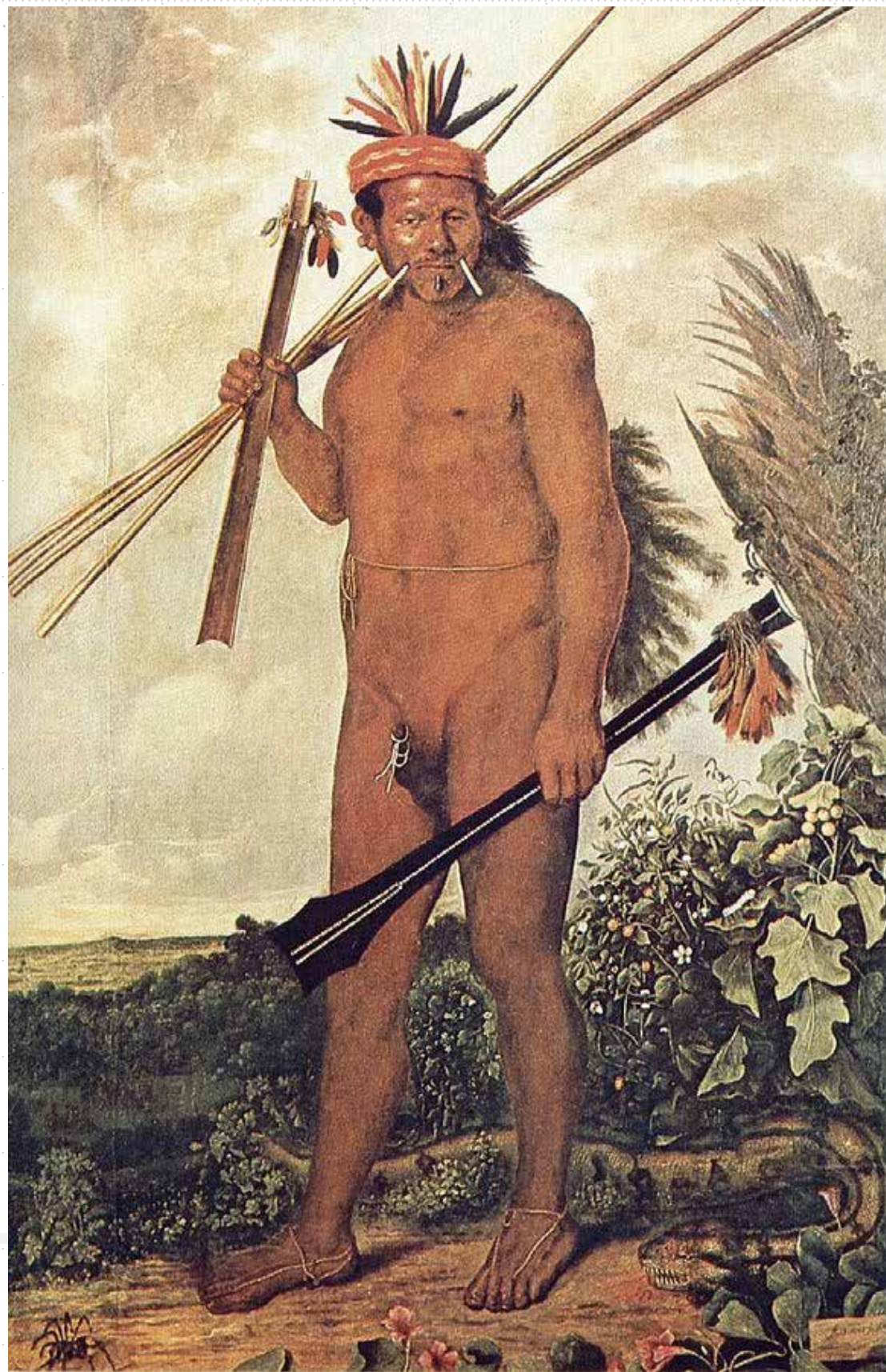
Figura 3: Hombre Tapuya (1641), de Albert Eckhout. óleo sobre tela, 272 x 161 cm. Fonte: https://pt.wikipedia.org/wiki/Albert_Eckhout

Vale ressaltar como já foi apontado que, talvez, o termo "retrato" não seja o mais adequado para se referir às imagens de González Palma, "(cuja) finalidade não é representar os indivíduos tal qual eles são; mas sim, como imitações de personagens arquetípicos da mitologia, da cultura popular e/ou da imaginação poética do artista" (CASTRO R, sd). No entanto, prefiro usar provisoriamente este termo porque a utilização do gênero retrato permite ao artista indagar sobre o impacto do olhar etnográfico a nível cultural e subjetivo e, ao mesmo tempo, sobre a extensa tradição visual que, a partir do século XVII, começa a ser articulada justamente por meio de versões etnográficas do retrato (BRIENEN, 2006).