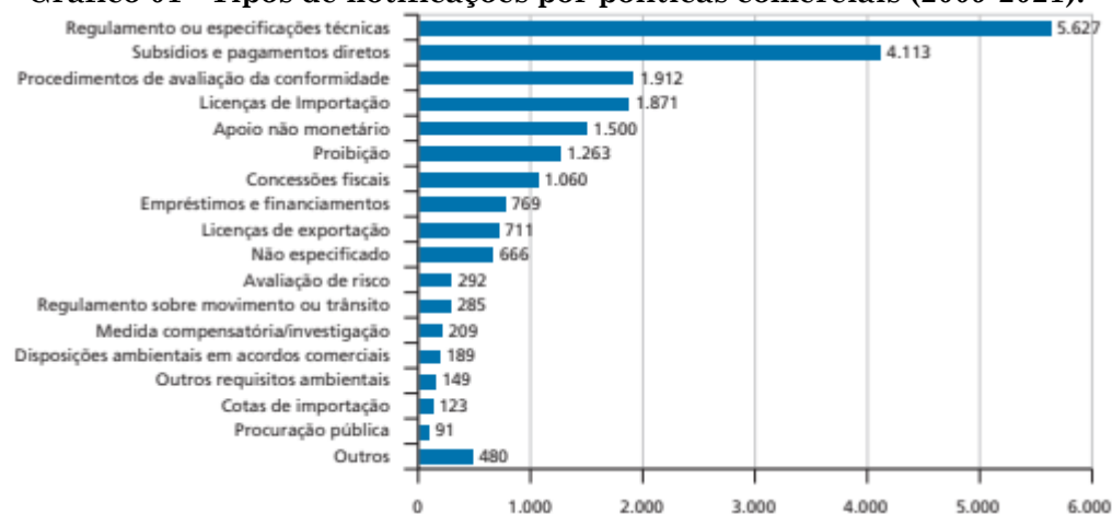
Gráfico 01 - Tipos de notificações por políticas comerciais (2009-2021).