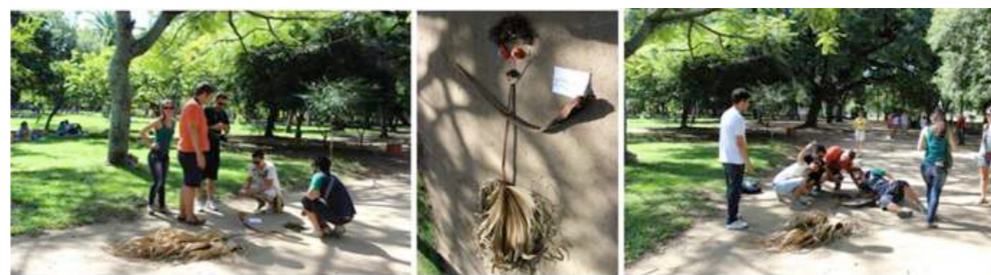
Figura 11 - Intervenção do Grupo A.