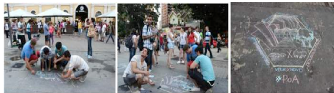
Figura 10 - Intervenção do Grupo A.