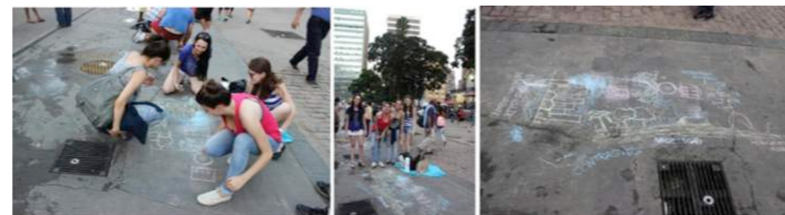
Figura 14 - Intervenção do Grupo A.

Para a Intervenção MateriArte o grupo escolheu um ponto no espaço que servisse de encontro de vários caminhos, permitindo que diversas pessoas, que estivessem realizando atividades variadas (brincando no playground, sentados no mobiliário na periferia do parque ou na grama) passassem por ali e vissem e pensassem sobre a composição. Foram representados os monumentos presentes em alguns dos parques muitas vezes marcando eixos centrais; o uso da bicicleta como um elemento que se destaca nos locais visitados; os diversos tipos de vegetação ou a falta da mesma; o espelho d'água que se apresentou em alguns espaços preservado e em outros não, e a diferença que causava tanto no conforto térmico quanto na composição da paisagem; e os elementos coloridos de diversos materiais (plástico, borracha, tecido) representando as pessoas ocupando os espaços e as diversas atividades que elas realizam.