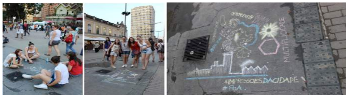
Figura 13 - Intervenção do Grupo A.