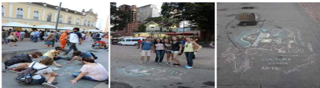
Figura 17 - Intervenção do Grupo A.