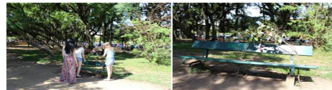
Figura 15 - Intervenção do Grupo A.