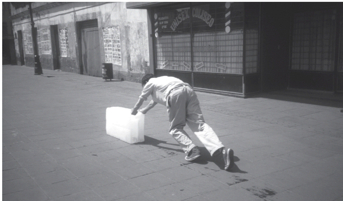
Figura 4 - Paradoxo da práxis 1: Às vezes fazer algo não leva à nada (1997)

O artista grava um vídeo em que persegue uma garrafa pelo Zócalo, no Centro Histórico da cidade. Tal objeto se movimenta de lá pra cá, ao poder do vento, dos transeuntes que a chutam, das crianças que com ela brincam. De repente, ele é atropelado por um automóvel; a câmera cai ao chão e o vídeo acaba.