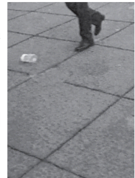
Figura 1 - O coletor (1991). Figura 2 - Conto de fadas (1995). Figura 3 - Se é um espectador típico, o que realmente fazes é esperar que aconteça o acidente (1996).