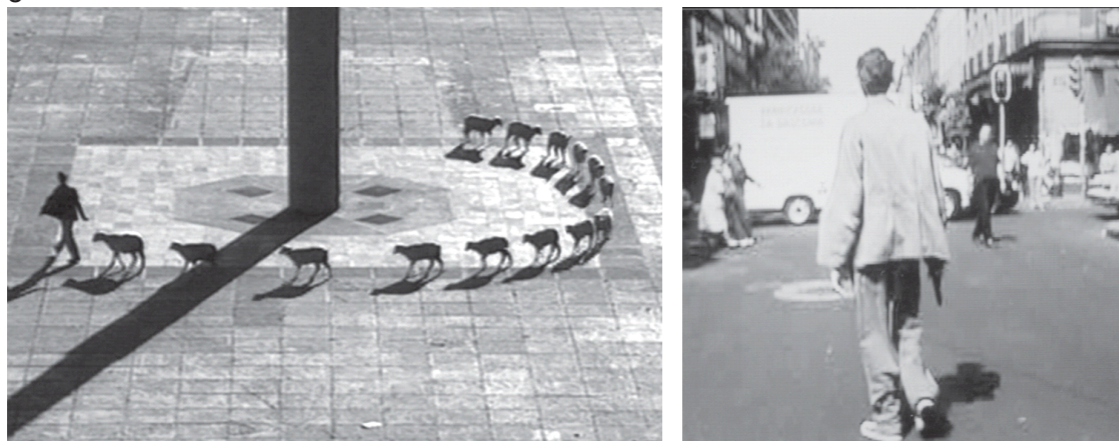
Figura 5 - Cantos patrióticos (1998 – 1999)

Durante mais de nove horas, empurrando um grande cubo de gelo pelas ruas do México até que ele derreta. Na obra, faz alusão à maioria dos trabalhos informais que a todo o momento surgem na capital. Haveria neles um grande esforço físico e poucos ganhos em termos econômicos ou subjetivos, como no caso dos catadores de lixo e garis.