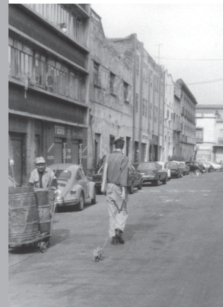
Figura 1 - O coletor (1991)

A arte de Alÿs é feita de diferentes maneiras, com vários tipos de materiais e formas de expressão, como desenho, pintura, escultura e vídeo performance. A seguir, apresentam-se algumas das 36 obras presentes em Dez quadras ao redor do estúdio. Prioriza-se àquelas em que o artista encontra-se imerso na cidade, caminhando por ela.