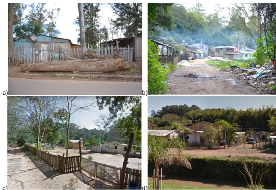
Figura 3 - Ocupações irregulares da Reserva Florestal Padre Balduino Rambo: a) Passo do Carioca; b) Campo do Carioca; c) Travessa São João; d) Sial -Arroio José Joaquim.

A ocupação “43 - Rua das Abelhas” no Bairro Horto Florestal é a que apresentou maior crescimento, visto que em 2006 esta ocupação se delimitava em apenas uma parte da Rua das Abelhas. Hoje, ela já ocupa uma grande extensão de área, com toda a extensão da rua ocupada e ainda com a criação da Travessa São João (Figuras 3c), para possibilitar maior quantidade de habitações. Assim como a ocupação “21 - Sial - Arroio José Joaquim”, no Bairro Freitas (Figura 3d), que se espalhou e duplicou de tamanho.