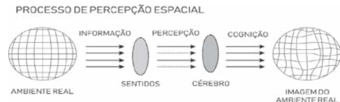
Figura 01: Erepresentação do processo perceptivo.

A percepção ambiental é o termo usado para designar o processo de interação entre o ser humano e o ambiente. Esse processo possui vários estágios com diferentes profundidades de interação, sendo a percepção e a cognição etapas do processo global de percepção ambiental (NAOUMOVA, 2009). De modo geral, existe uma diferença simples entre a percepção e a cognição. A primeira refere-se a situações em que a resposta depende das propriedades físicas e dos estímulos, enquanto a segunda relaciona-se ao conhecimento, e assim, se desenvolvem vários meios de consciência, significado e simbolismo com o ambiente (KANASHIRO, 2003). O produto final desses dois processos, percepção e cognição, é a representação mental que um indivíduo faz do ambiente que está inserido (Figura 01), sendo que é essa representação que ele vai considerar na avaliação do ambiente (PORTELLA, 2003).