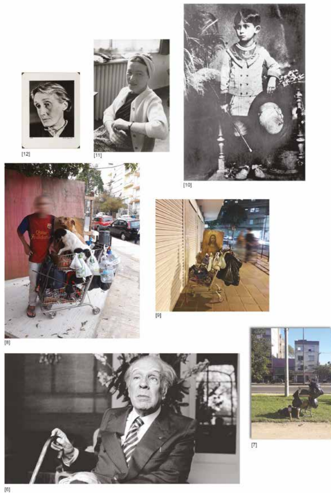
Figura 2 - Montagem, prancha 02.