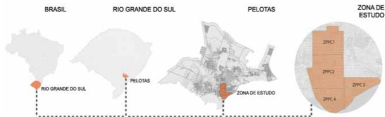
Figura 3 - Zonas de Preservação do Patrimônio Cultural de Pelotas. Fonte: Acervo digital do NEAB. Figura 4 - Documentação histórica: mapa da cidade de Pelotas, 1835. Fonte: GUTIERREZ, 2001, p. 169.