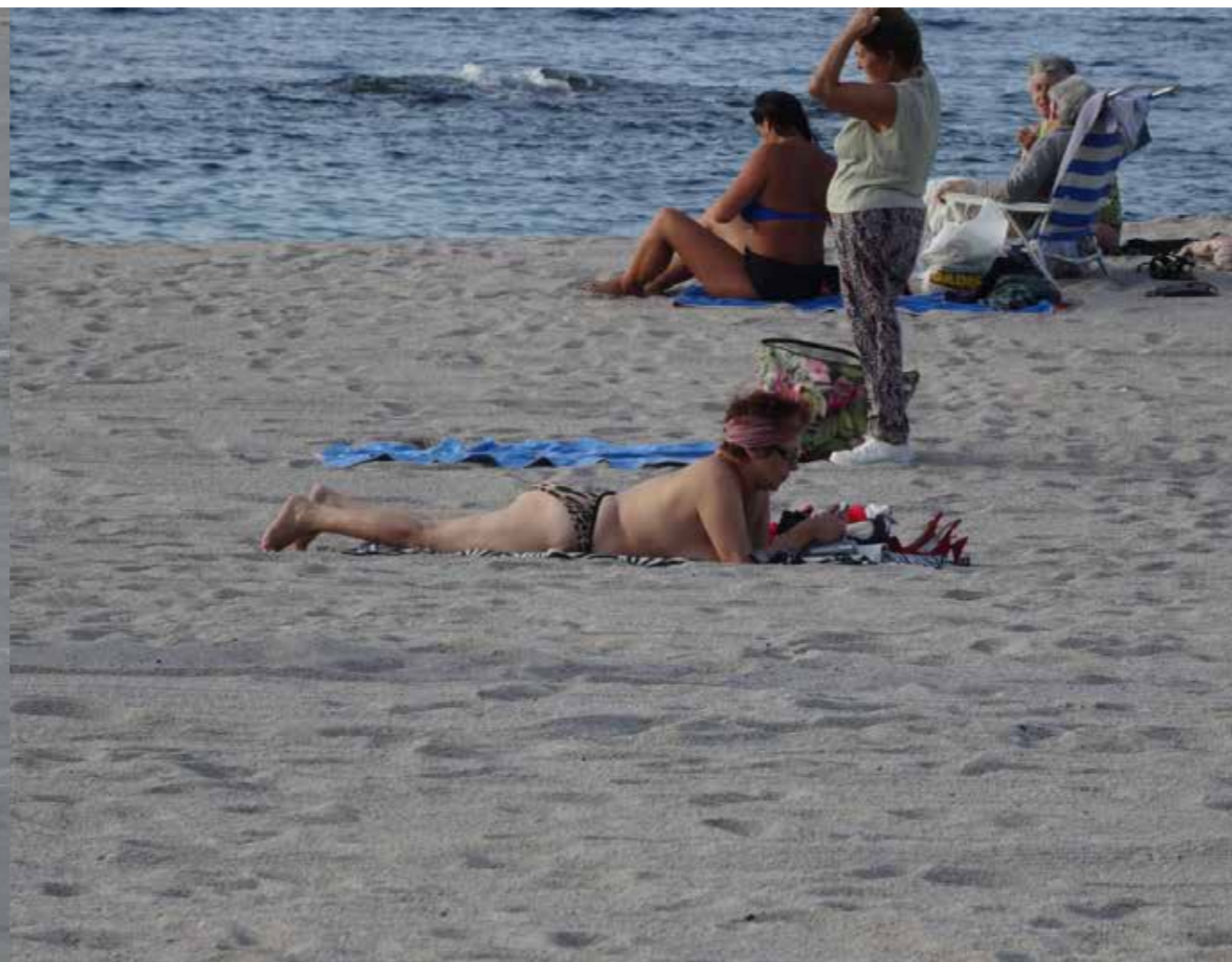
Espanha, La Coruna.