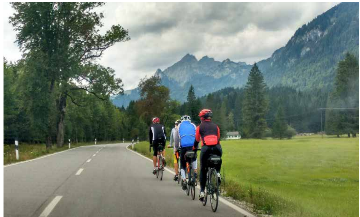
Pedalando na Alemanha. Foto tirada na estrada da Rota dos Castelos no sul da Alemanha, idosos estavam pedalando tranquilamente e muito bem equipados. Autora: Adriana Cavalli, 2017.