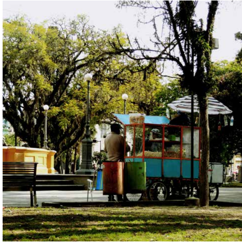
No Entardecer da Vida em Belo Horizonte. Praça da Liberdade, Belo Horizonte, Brasil. Autora: Daniela Bilhalva, 2019.