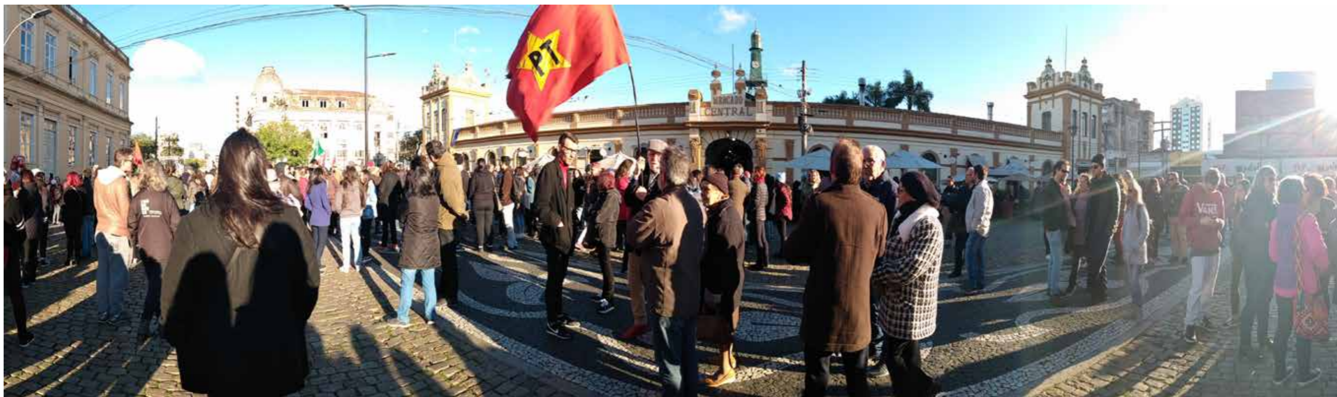
Idosos em manifestação em defesa da educação em Pelotas/RS Brasil.