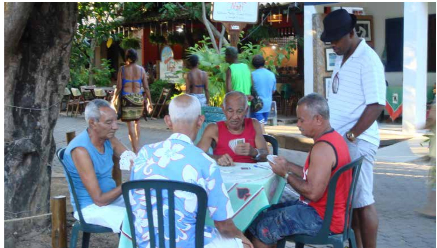
Carteando na Bahia . Foto tirada nas ruas da Praia do Forte Bahia/Brasil, homens jogando cartas no meio da rua, em uma sombra gostosa em um dia quente de verão. Autora: Adriana Cavalli, 2013.