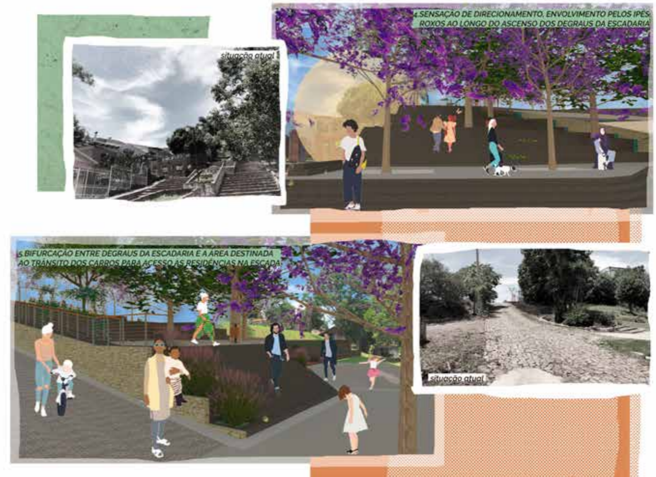
Figura 7 – Imagens antes e depois do projeto.