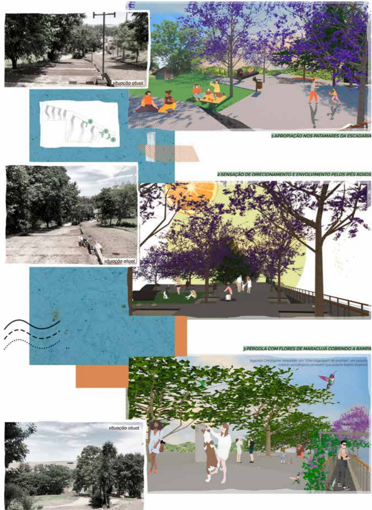
Figura 6 – Imagens antes e depois do projeto.