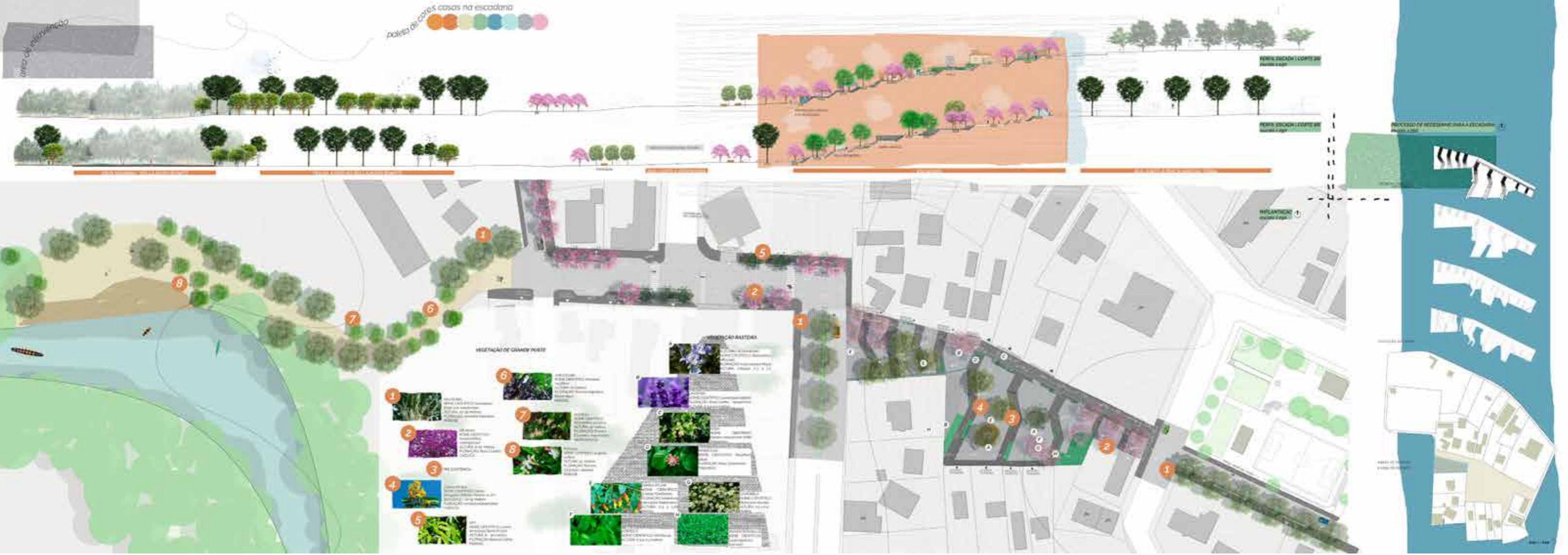
Figura 1 – Projeto do Percurso.