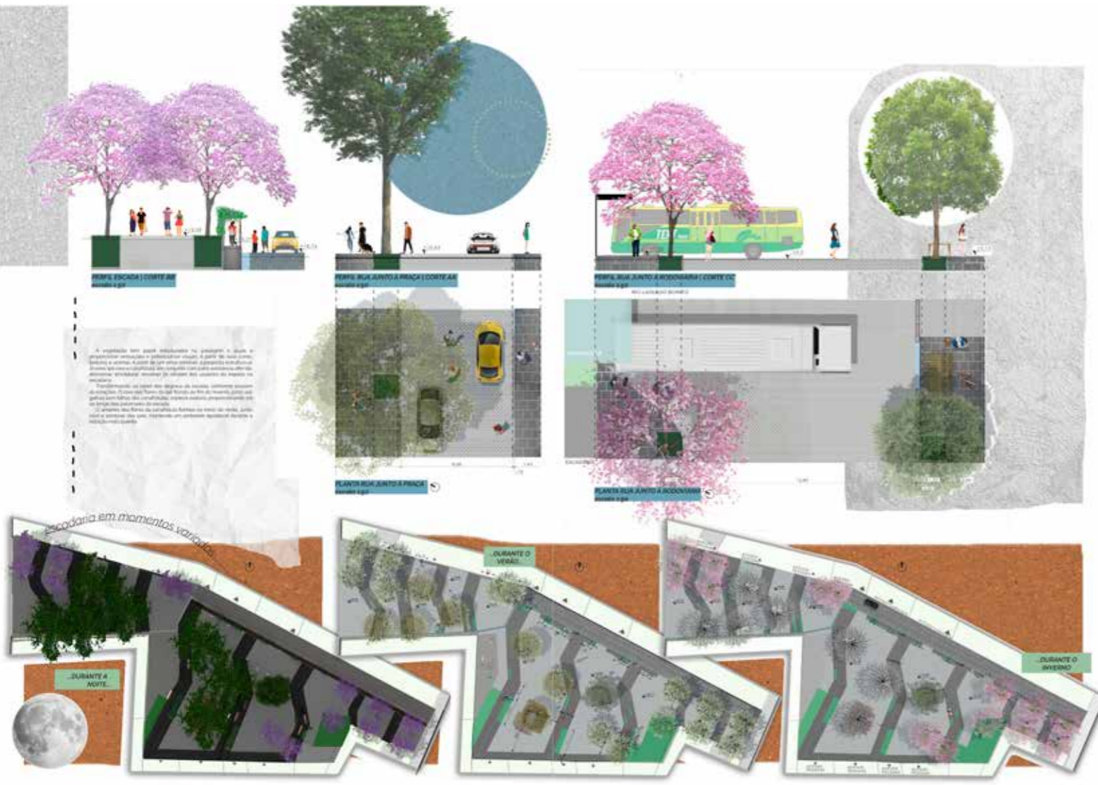
Figura 2 – Projeto dos perfis viários e do paisagismo.