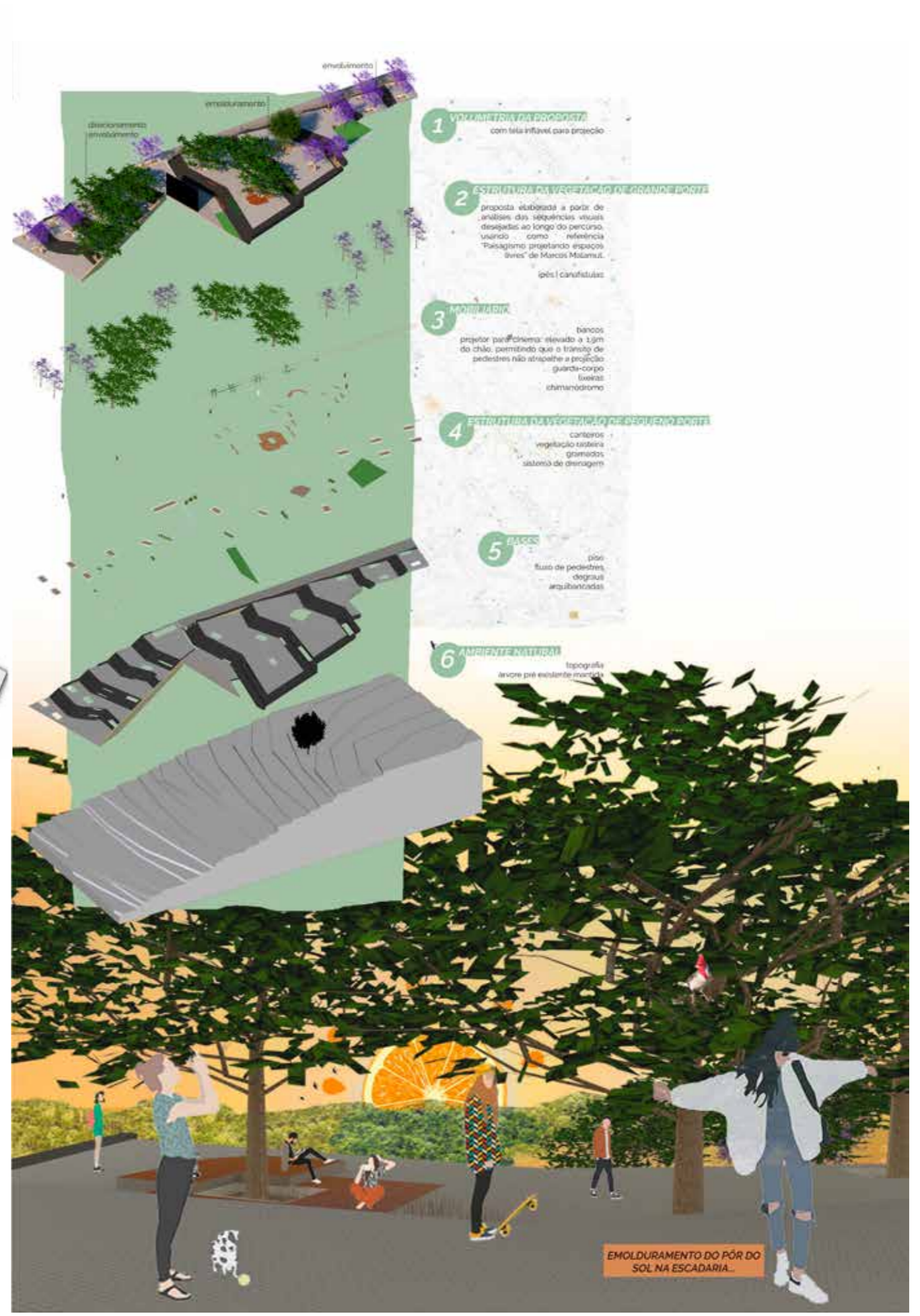
Figura 3 – Camadas espaço-temporal do projeto da escadaria. Fonte: da autora, 2019.