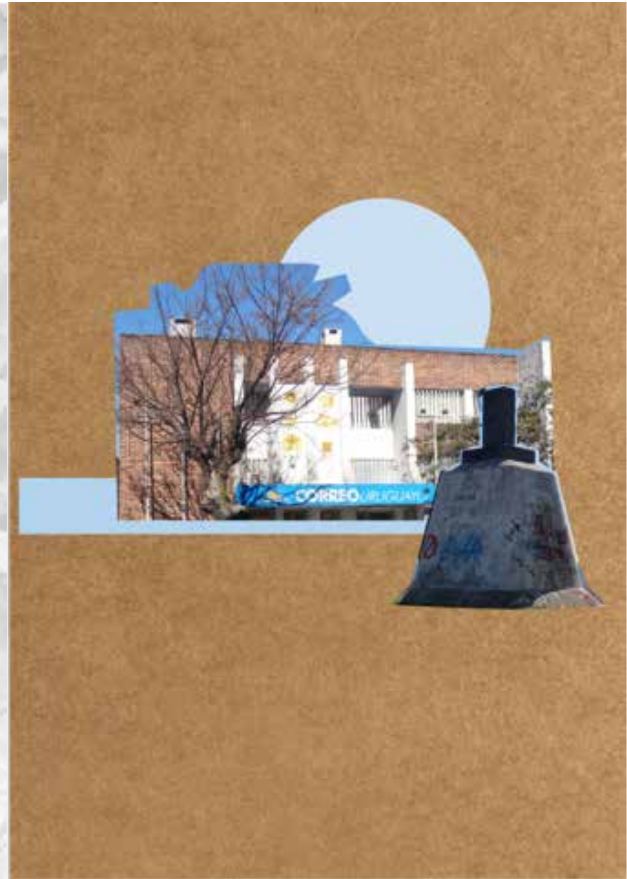
Collage Santana do Livramento-Rivera.